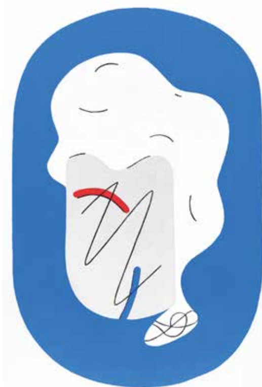
GÊMEO SERENO Acrílico e spray sobre tela, 40x50 cm, 2022