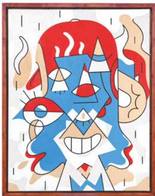
ALMA 01 Acrílico e spray sobre tela, 70x90 cm, 2021