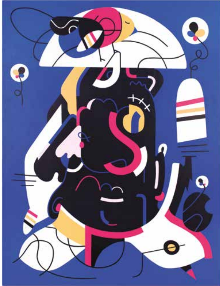
SENTIDO APURADO Acrílico e spray sobre tela, 70x90 cm, 2023