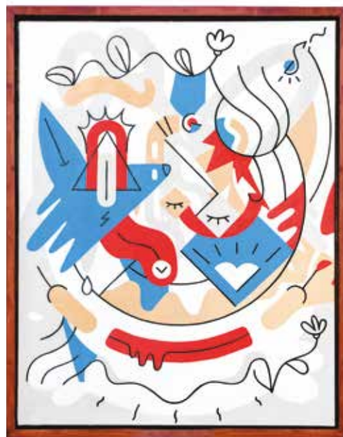
ALMA 02 Acrílico e spray sobre tela, 70x90 cm, 2021