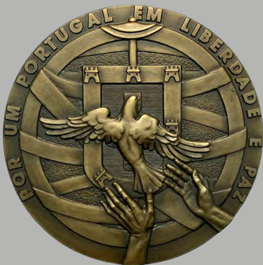
6 Comemorativa do V Aniversário do 25 de Abril Por um Portugal em Liberdade