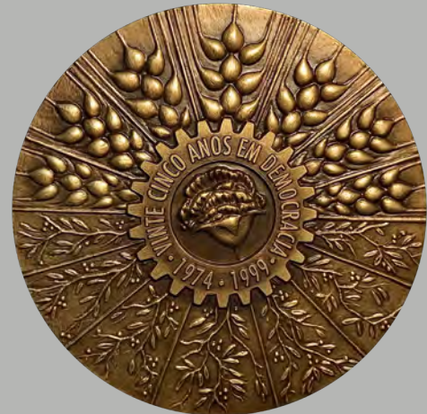
I Vinte Cinco Anos em Democracia 1974 / 1999