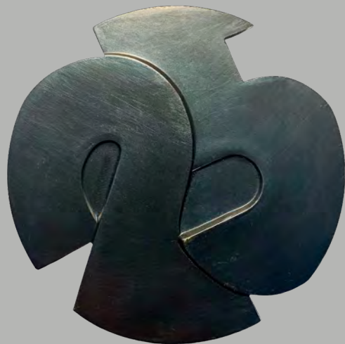
9 Revolução de 1974 10º Aniversário