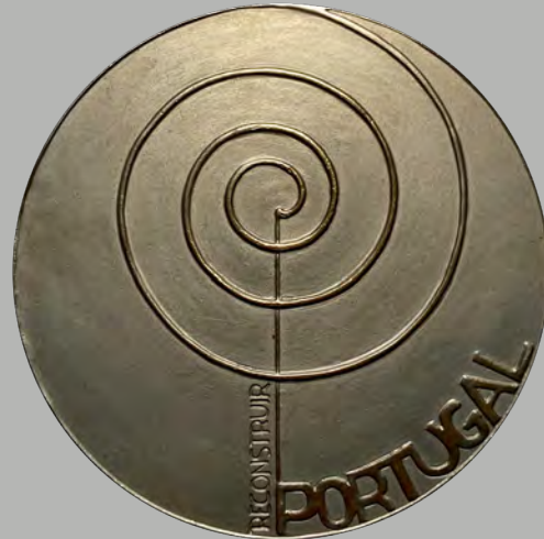
43 MFA 25 de Abril do Ano de 1974