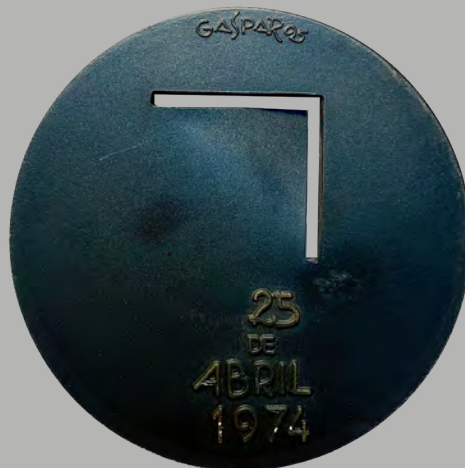
II Rasgamos Caminhos 1995 Associação 25 de Abril