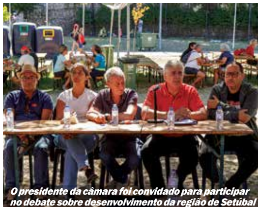
O presidente da câmara foi convidado para participar no debate sobre desenvolvimento da região de Setúbal