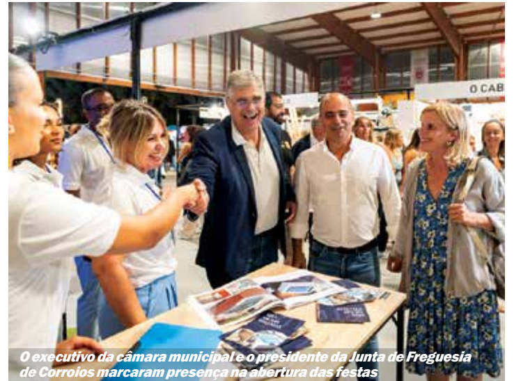
O executivo da câmara municipal e o presidente da Junta de Freguesia de Corroios marcam presença na abertura das festas