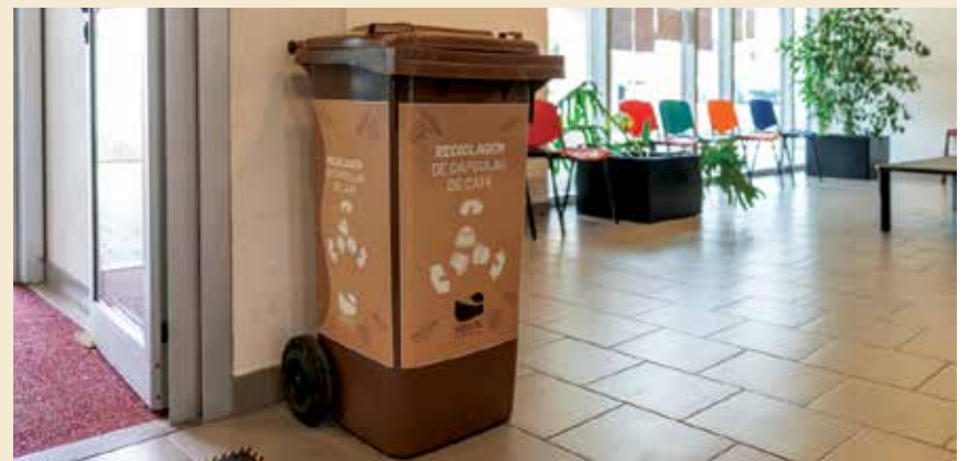
Contentor de cápsulas de café

Deposite as cápsulas usadas nestes contentores e ajude a reduzir a quantidade de resíduos que vão parar aos aterros.