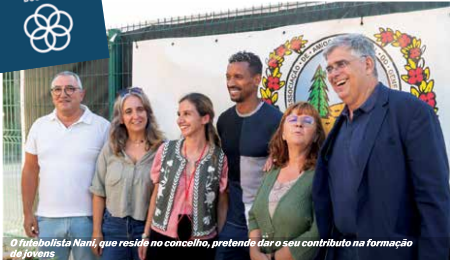
O futebolista Nani, que reside no concelho, pretende dar o seu contributo na formação de jovens