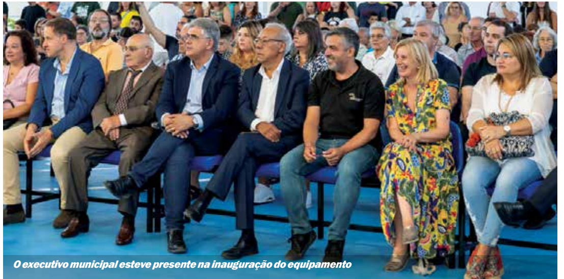
O executivo municipal esteve presente na inauguração do equipamento