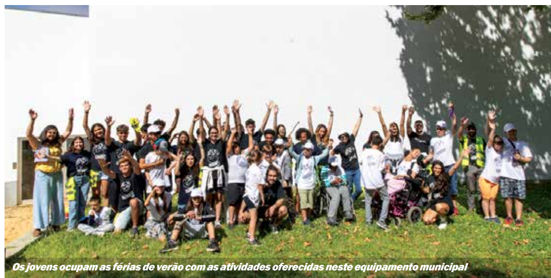
Os jovens ocupam as férias de verão com as atividades oferecidas neste equipamento municipal