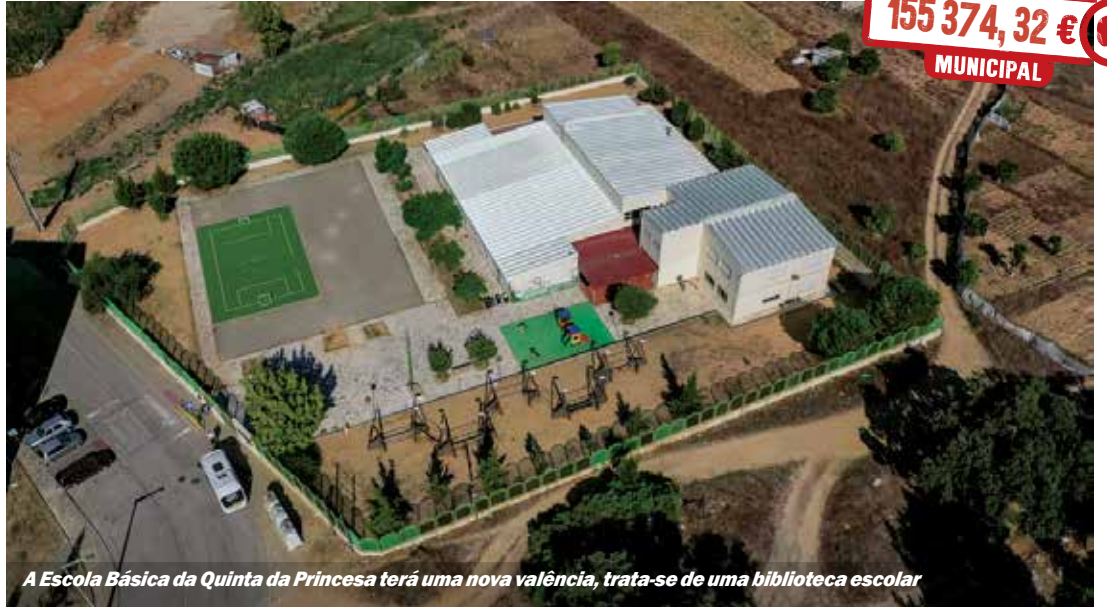
A Escola Básica da Quinta da Princesa terá uma nova valência, trata-se de uma biblioteca escolar