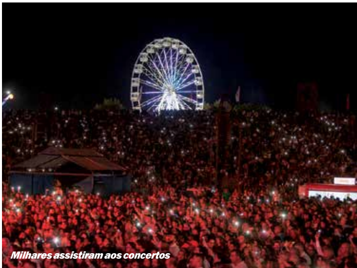
Milhares assistiram aos concertos