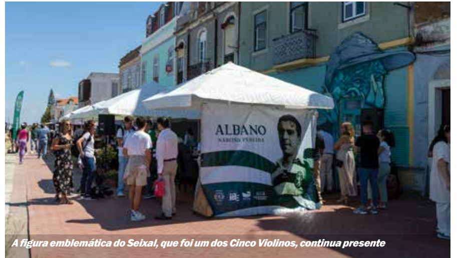
A figura emblemática do Seixal, que foi um dos Cinco Violinos, continua presente

O projeto está em fase de pré-inscrição de jovens jogadores e as atividades devem iniciar-se no mês de outubro.