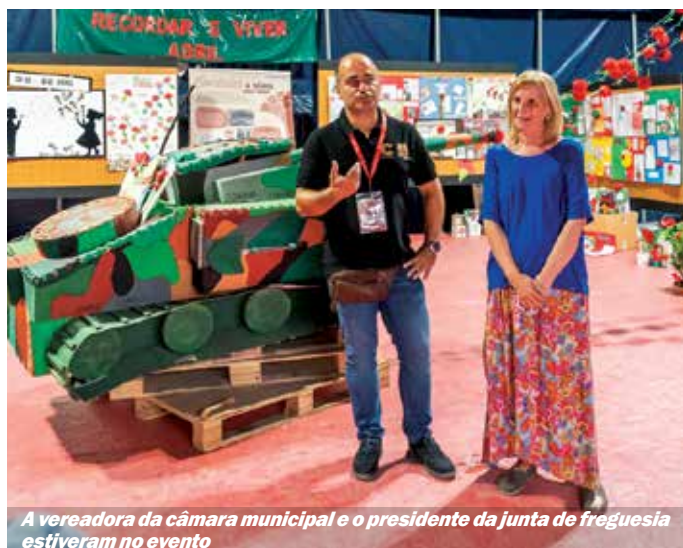
A vereadora da câmara municipal e o presidente da junta de freguesia estiveram no evento