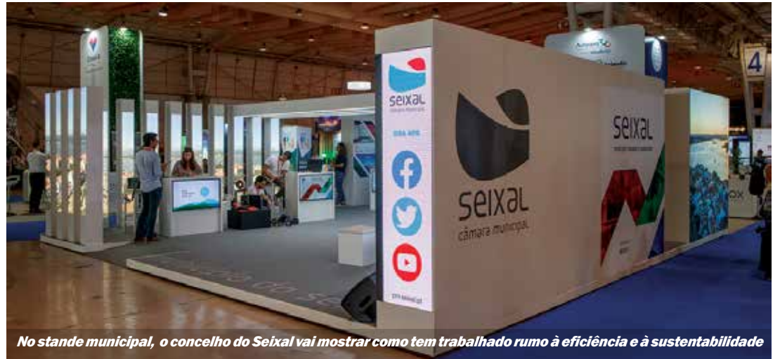
No stande municipal, o concelho do Seixal vai mostrar como tem trabalhado rumo à eficiência e à sustentabilidade

Conscientes da importância em reciclar e reutilizar, os municípios do concelho têm sido exemplares nesta matéria. O Seixal é um dos três municípios do país com melhor desempenho na reciclagem