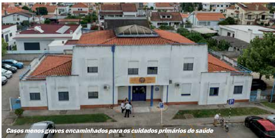
Casos menos graves encaminhados para os cuidados primários de saúde

No concelho do Seixal, a inovação está ao serviço da sustentabilidade, do território e das pessoas. ■