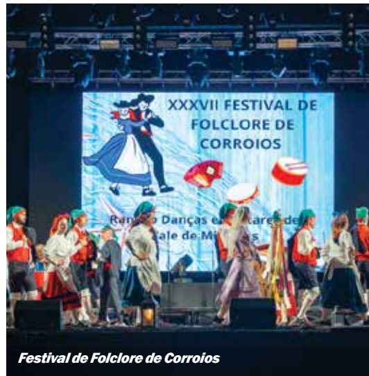
Festival de Folclore de Corroios