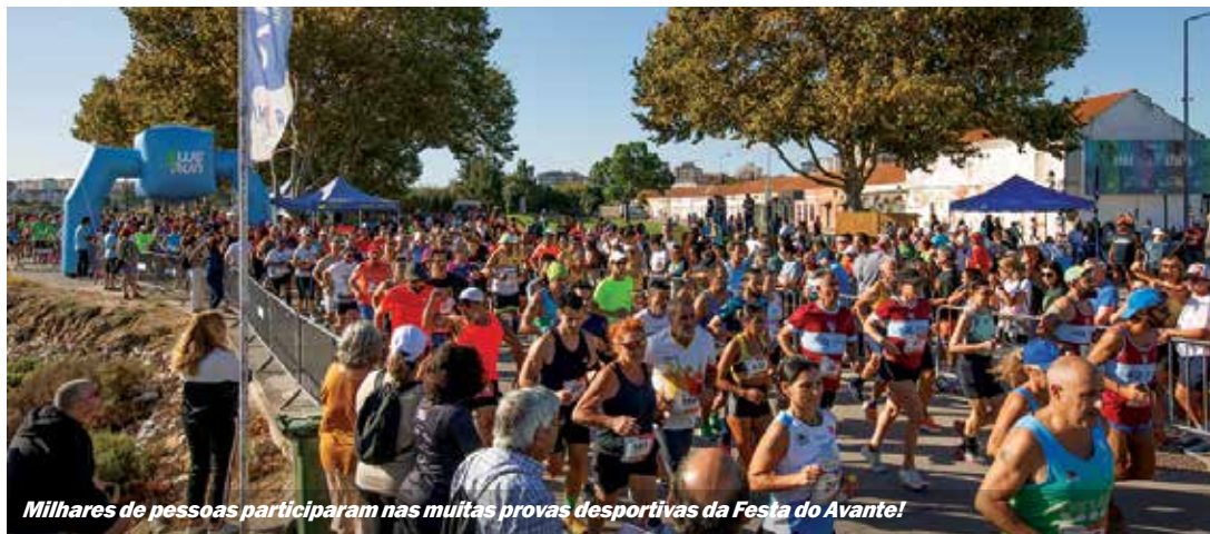
Milhares de pessoas participaram nas muitas provas desportivas da Festa do Avante!