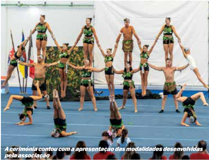
A cerimónia contou com a apresentação das modalidades desenvolvidas pela associação