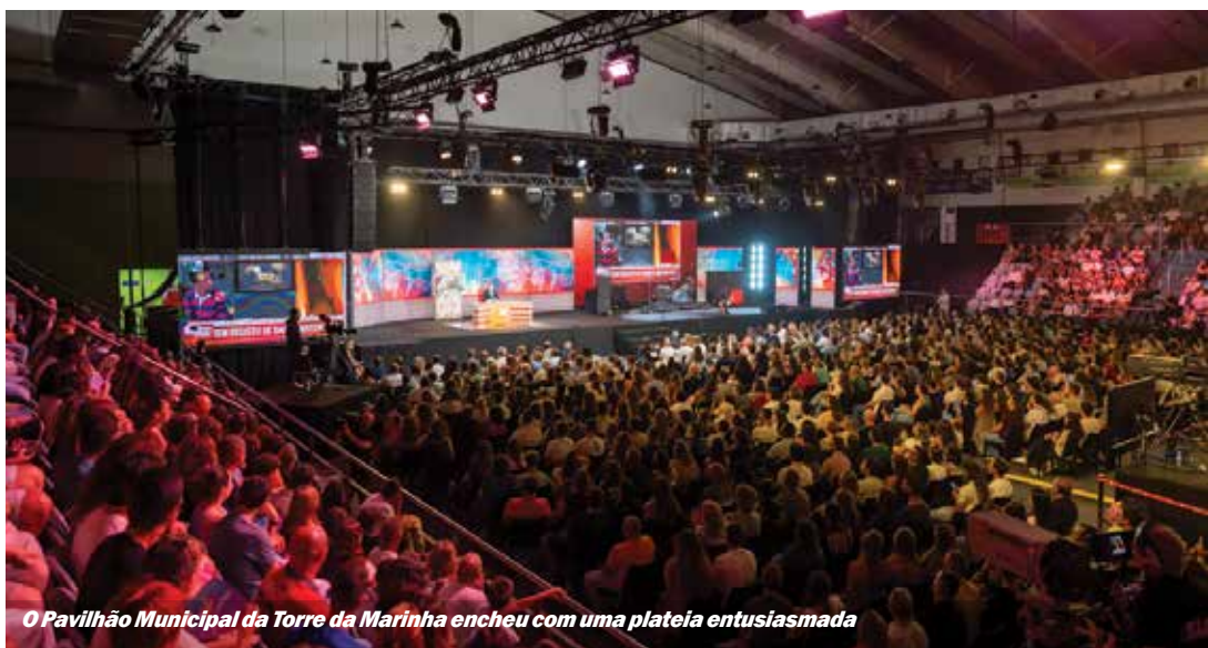
O Pavilhão Municipal da Torre da Marinha encheu com uma plateia entusiasmada