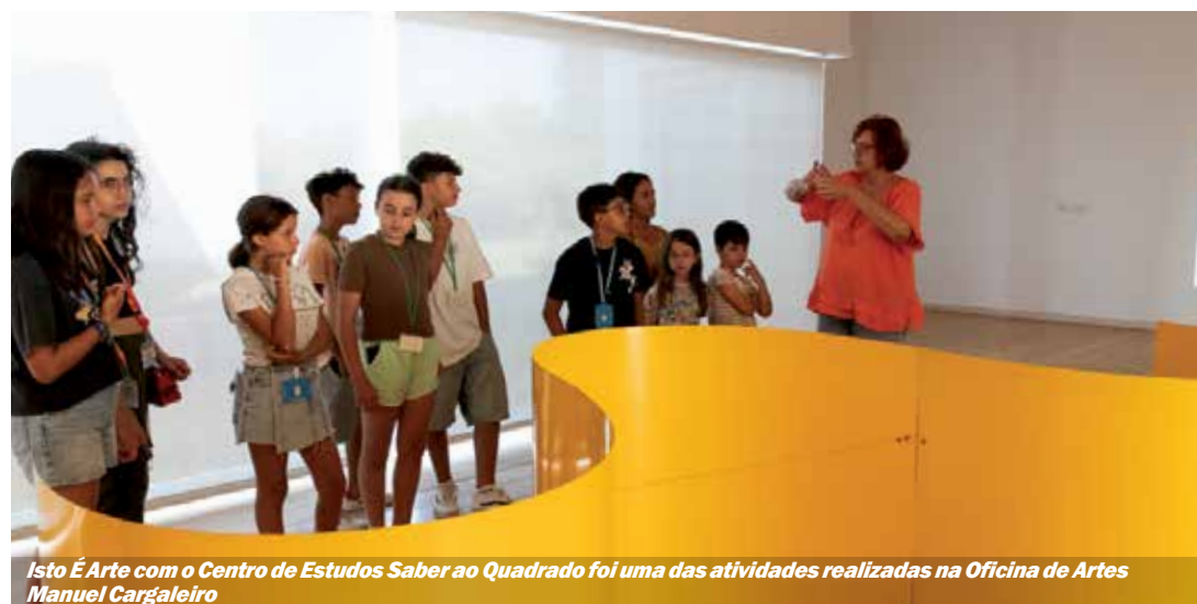
Isto É Arte com o Centro de Estudos Saber ao Quadrado foi uma das atividades realizadas na Oficina de Artes Manuel Cargaleiro