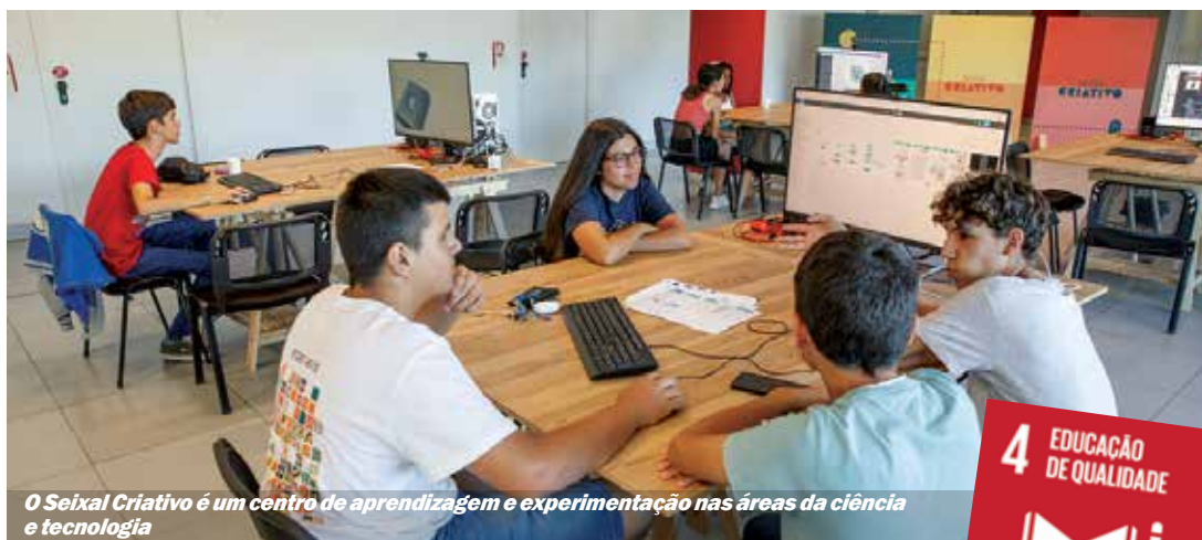
O Seixal Criativo é um centro de aprendizagem e experimentação nas áreas da ciência e tecnologia