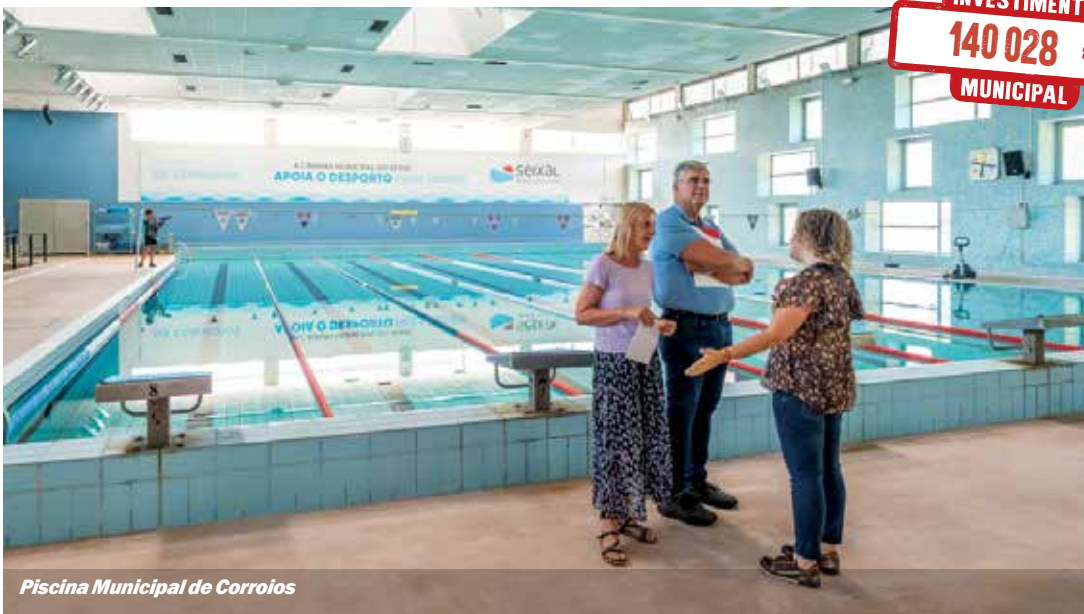
Piscina Municipal de Corroios