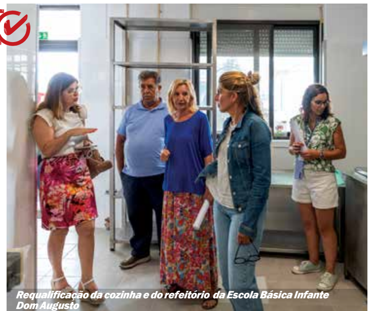
Requalificação da cozinha e do refeitório da Escola Básica Infante Dom Augusto