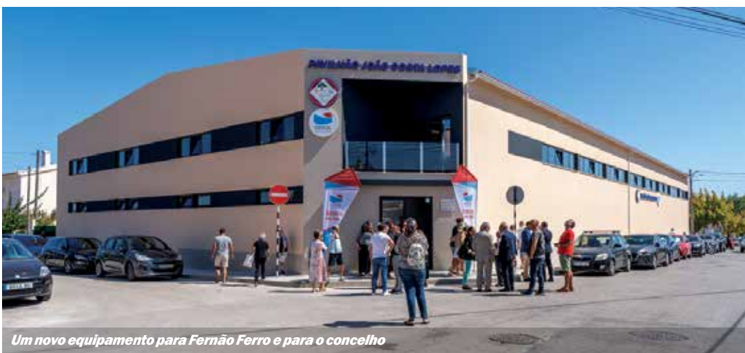
Um novo equipamento para Fernão Ferro e para o concelho

O dia foi de festa pela realização de um sonho há muito ansiado, quer pela direção, quer pelos atletas e técnicos, como os próprios expressaram através das demonstrações desportivas que efetuaram durante a cerimónia de inauguração. ■