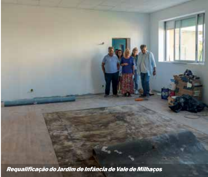
Requalificação do Jardim de Infância de Vale de Milhaços