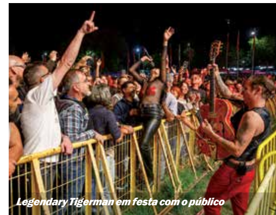
Legendary Tigerman em festa com o público