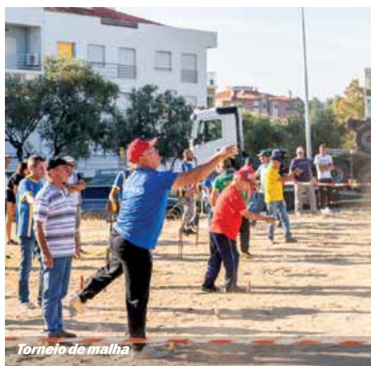
Torneio de malha