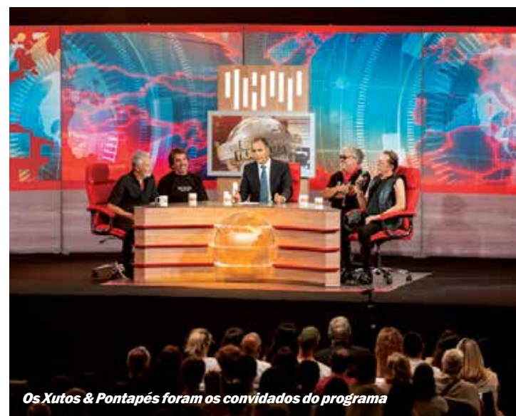
Os Xutos & Pontapés foram os convidados do programa

O PRIMEIRO episódio da nova temporada do programa «Isto É Gozar com Quem Trabalha» foi gravado dia 1 de setembro no Pavilhão Municipal da Torre da Marinha e emitido em direto pela SIC para Portugal inteiro.