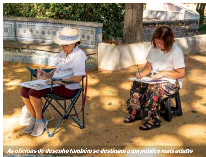
As oficinas de desenho também se destinam a um público mais adulto

Também na Oficina de Artes Manuel Cargaleiro decorreram visitas, oficinas e workshops, em que os visitantes ficaram a conhecer melhor a obra de Manuel Cargaleiro e visitaram a exposição Matéria/Ação: Escultura e vídeo dos anos 1960 e 1970, a qual integra o Programa de Exposições Itinerantes da Coleção de Serralves, e que esteve patente no local. ■