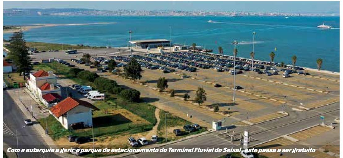
Com a autarquia a gerir o parque de estacionamento do Terminal Fluvial do Seixal, este passa a ser gratuito

Refira-se que, em agosto de 2021, a câmara municipal já tinha tomado uma medida similar, pas-