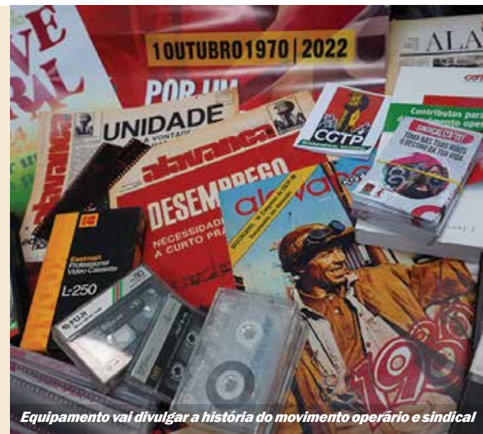
Equipamento vai divulgar a história do movimento operário e sindical