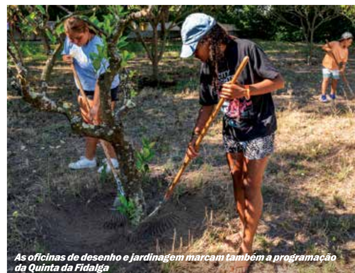
As oficinas de desenho e jardinagem marcam também a programação da Quinta da Fidalga

Jardins e equipamentos recebem atividades regulares