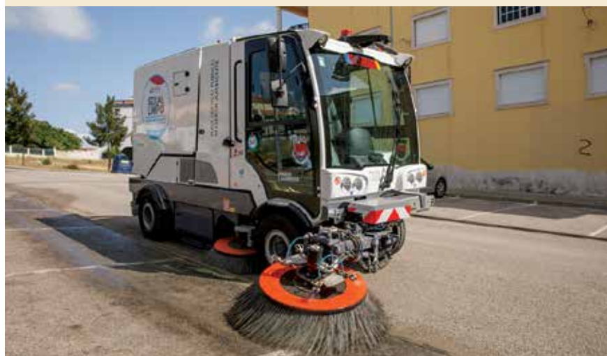
A autarquia utiliza a varredura manual e mecânica para manter as ruas limpas

A inovação está sempre presente. Assim, em outubro, terá início um projeto-piloto com a instalação de quatro papeleiras inteligentes . Estas apresentam uma maior capacidade de armazenamento devido ao sistema de compactação. Além disso, estão equipadas com uma tecnologia que indica remotamente o nível de enchimento, otimizando assim as rotas de recolha de resíduos.