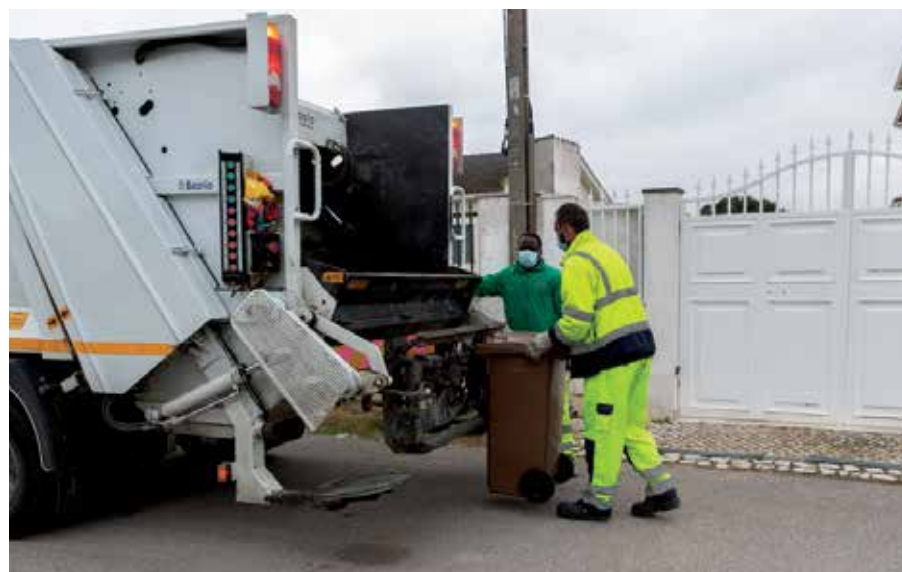
Entre janeiro e setembro de 2024 foram recolhidas 2 295 toneladas de biorresíduos. Se esta tendência se mantiver até final do ano, prevemos recolher cerca de 3 512 toneladas.

A Câmara Municipal do Seixal iniciou a recolha seletiva de biorresíduos em 2019, em moradias, nas localidades com recolha de resíduos porta a porta. Atualmente estão servidas com este tipo de recolha cerca de 20 500 famílias , das quais 11 620 (57 por cento) aderiram ao projeto Recolher Porta a Porta para Valorizar e já separam os seus biorresíduos. Em junho de 2024, a Câmara Municipal do Seixal alargou a recolha seletiva de biorresíduos ao canal HORECA – restaurantes e cantinas. Atualmente estão abrangidos por este serviço cerca de 70 estabelecimentos .