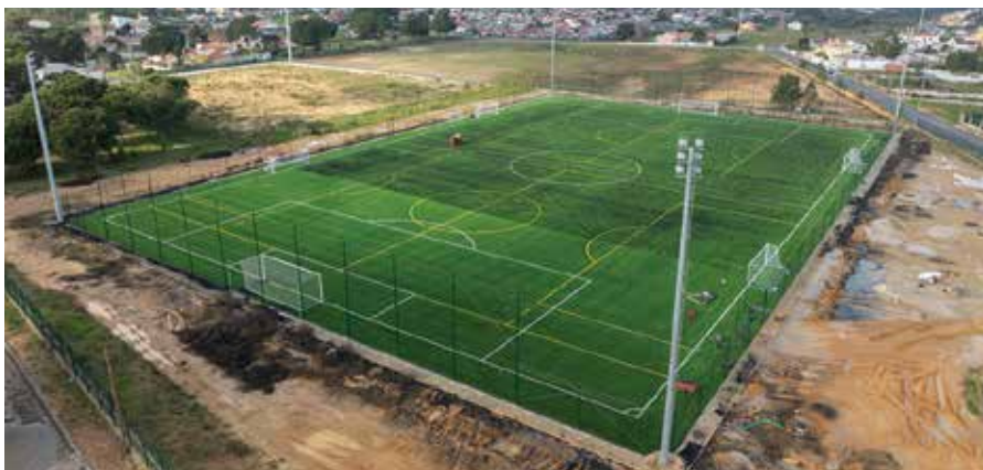
Abertura do Complexo Desportivo do Pinhal do General, em fase de construção