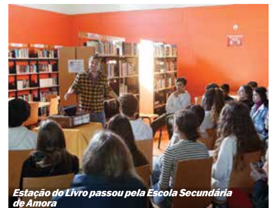
Estação do Livro passou pela Escola Secundária de Amora