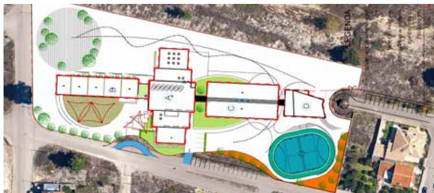
Programação da nova Escola Básica do Pinhal do General, em Fernão Ferro, com pré-escolar

Além do trabalho diário com o desenvolvimento de ações e programas, estão em curso ou a ser preparados projetos em diversas áreas, dos quais destacamos alguns.