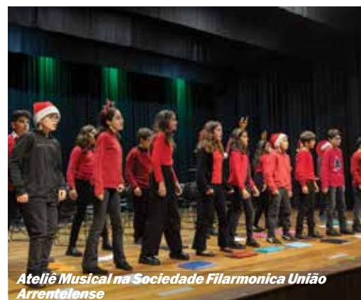
Ateliê Musical na Sociedade Filarmónica União Arrentelense