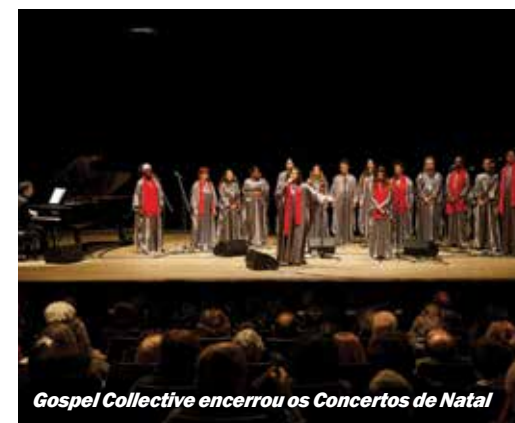
Gospel Collective encerrou os Concertos de Natal