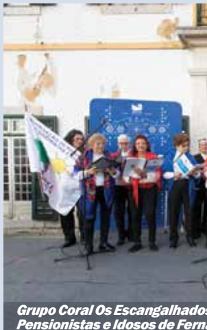
Grupo Coral Os Escangalhados Pensionistas e Idosos de Fernandópolis