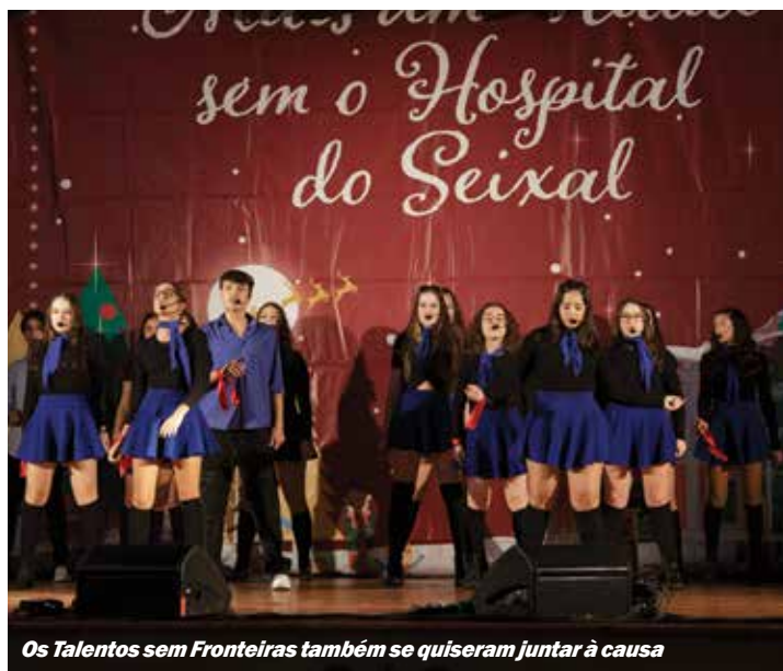
Os Talentos sem Fronteiras também se quiseram juntar à causa