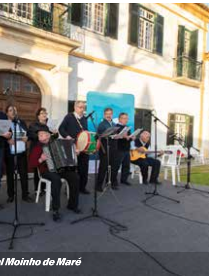
Os Moinhos de Maré