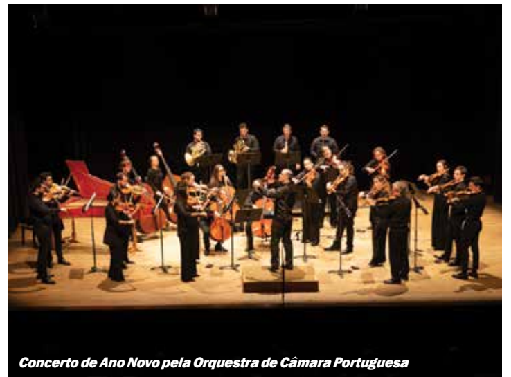
Concerto de Ano Novo pela Orquestra de Câmara Portuguesa