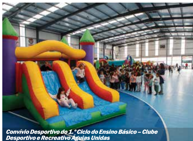
Convívio Desportivo do 1.º Ciclo do Ensino Básico – Clube Desportivo e Recreativo Agulhas Unidas