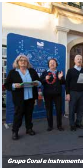
Grupo Coral e Instrumental