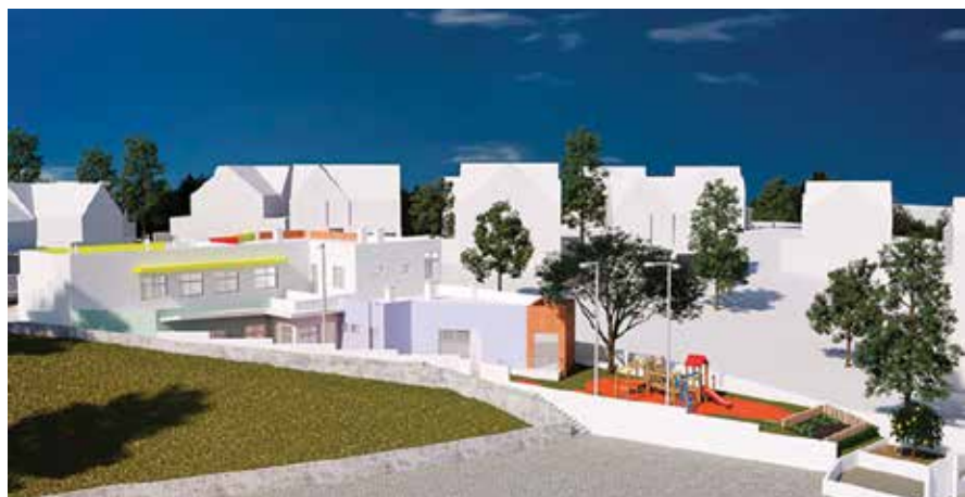
A Creche Social de Miratejo já se encontra em construção com apoio da autarquia