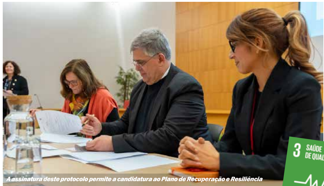
A assinatura deste protocolo permite a candidatura ao Plano de Recuperação e Resiliência