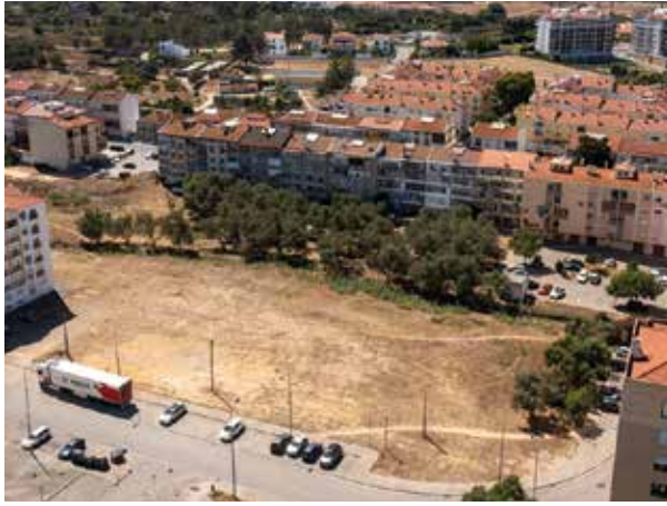
Já foi assinado o protocolo de colaboração para a construção do Centro de Saúde de Paio Pires, com apoio municipal e cedência de terreno por parte da autarquia