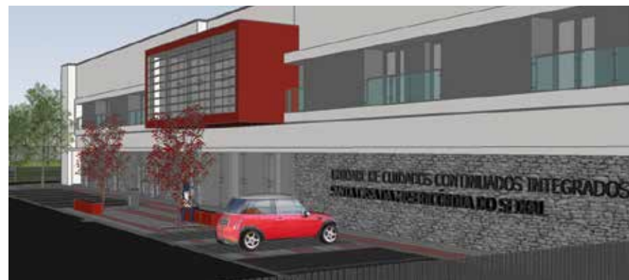
Apoio à construção de uma Unidade de Cuidados Continuados Integrados, em Arrentela, em terreno já cedido e com projeto financiado pela autarquia