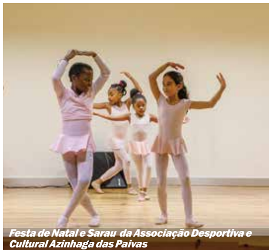
Festa de Natal e Sarau da Associação Desportiva e Cultural Azinhaga das Paivas

Clubes, coletividades e associações demonstraram uma vez mais a sua intensa atividade desportiva, cultural e recreativa, com iniciativas que juntaram atletas, famílias, treinadores, amigos, dirigentes e o executivo municipal, e onde se pôde constatar a força e o dinamismo do movimento associativo no nosso concelho.