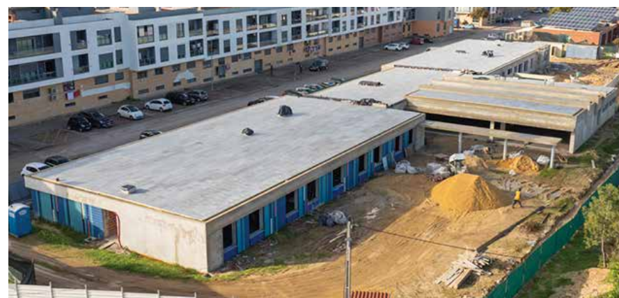
Construção da Estrutura Residencial para Pessoas Idosas de Fernão Ferro