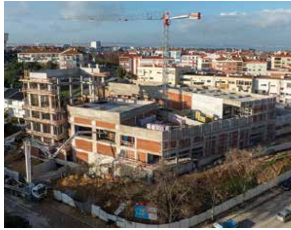
Conclusão da construção do Centro Cultural José Saramago, em Amora