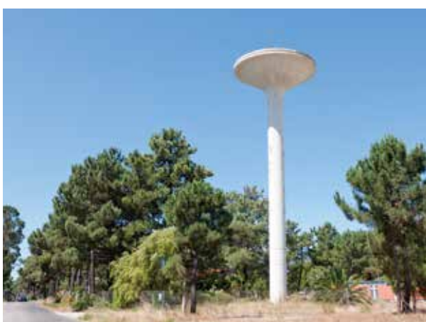
Início da ampliação e requalificação do Centro Distribuidor de Água de Belverde