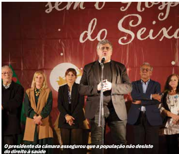
O presidente da câmara assegurou que a população não desiste do direito à saúde