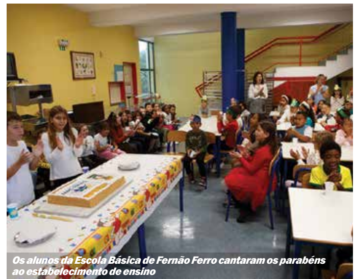
Os alunos da Escola Básica de Fernão Ferro cantaram os parabéns ao estabelecimento de ensino

Ainda no mês de dezembro, a Escola Básica da Cruz de Pau recebeu uma sessão sobre a Olaria Romana da Quinta do Rouxinol, que deu a conhecer o património deste Monumento Nacional, situado em Corroios.