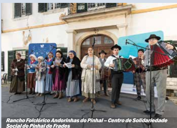
Rancho Folclórico Andorinhas do Pinhal - Centro de Solidariedade Social de Pinhal de Frades