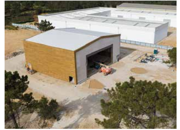
Conclusão da construção da Aldeia do Bombo, em Aldeia de Paio Pires