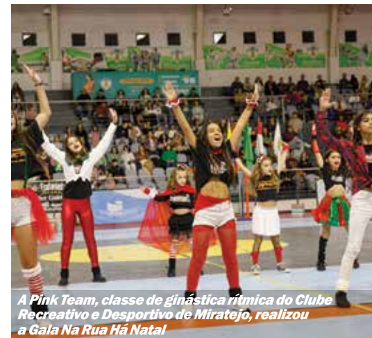
A Pink Team, classe de ginástica rítmica do Clube Recreativo e Desportivo de Miratejo, realizou a Gala Na Rua Há Natal