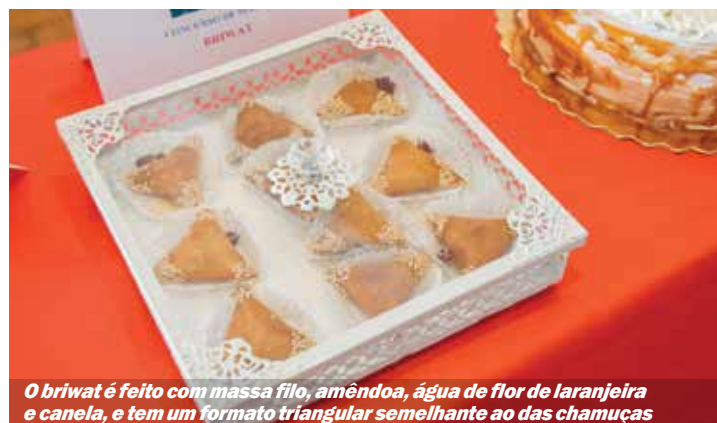
O briwat é feito com massa filo, amêndoa, água de flor de laranjeira e canela, e tem um formato triangular semelhante ao das chamuças

E para que nenhuma criança perdesse a oportunidade de viver a quadra em todas estas diversões, a Câmara Municipal do Seixal proporcionou a todos os alunos do pré-escolar e do ensino básico da rede pública do concelho a ida à Aldeia Natal do Seixal. Uma iniciativa que fez as delícias das crianças. ■