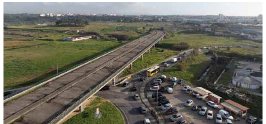
Vai avançar a construção da alternativa à EN10, entre Corroios e Amora