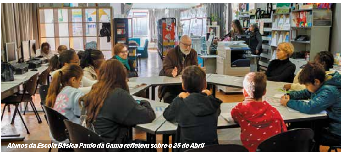
Alunos da Escola Básica Paulo da Gama refletem sobre o 25 de Abril