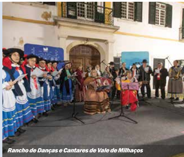
Rancho de Danças e Cantares de Vale de Milhaços