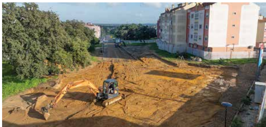
Construção da Estrutura Residencial para Pessoas Idosas do Casal do Marco com apoio municipal, em terreno já cedido e com projeto financiado pela autarquia