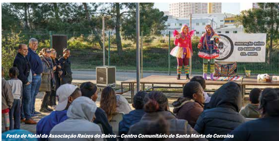
Festa de Natal da Associação Raízes do Bairro – Centro Comunitário de Santa Marta de Corroios

Instituições assinalam a quadra de Natal