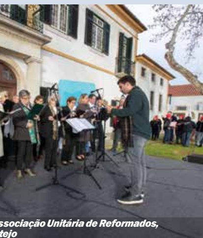
Associação Unitária de Reformados, Paio Pires