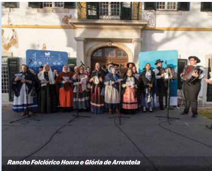
Rancho Folclórico Honra e Glória de Arrentela