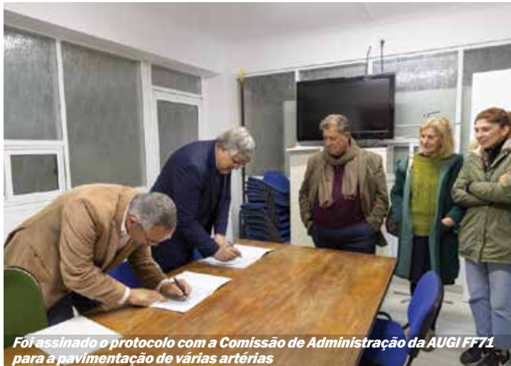
Foi assinado o protocolo com a Comissão de Administração da AUGI FF71 para a pavimentação de várias artérias