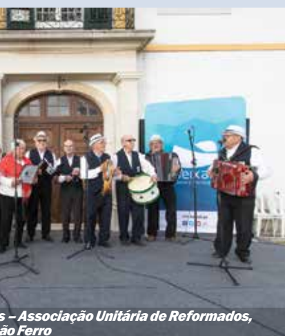
Os Moinhos de Maré - Associação Unitária de Reformados, Paio Pires