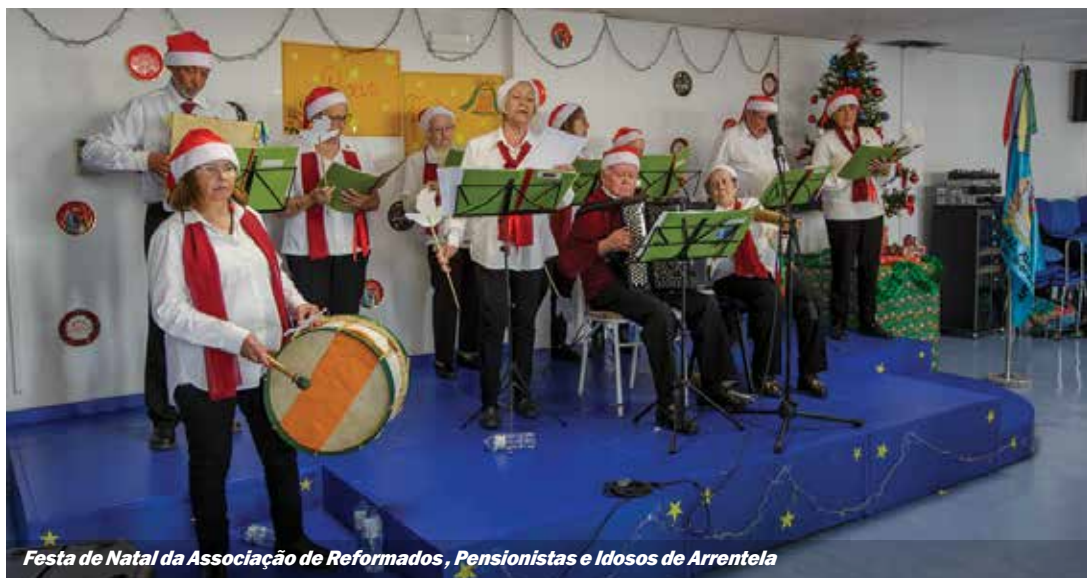
Festa de Natal da Associação de Reformados, Pensionistas e Idosos de Arrentela