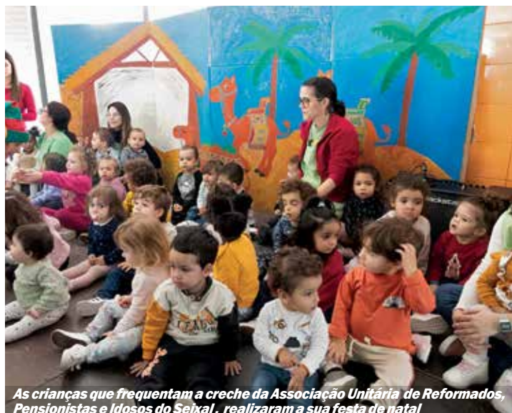
As crianças que frequentam a creche da Associação Unitária de Reformados, Pensionistas e Idosos do Seixal, realizaram a sua festa de natal