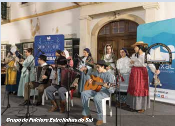
Grupo de Folclore Estrelinhas do Sul