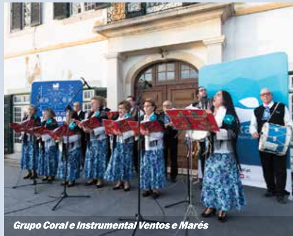
Grupo Coral e Instrumental Ventos e Marés