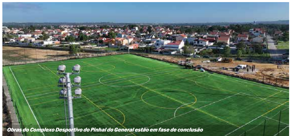
Obras do Complexo Desportivo do Pinhal do General estão em fase de conclusão

Eleitos da câmara do Seixal dedicam o dia a Fernão Ferro