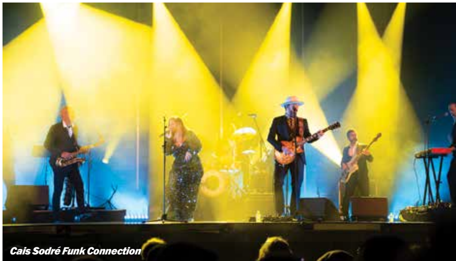
Cais Sodré Funk Connection