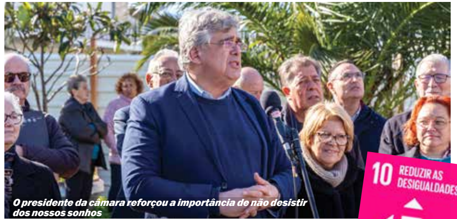
O presidente da câmara reforçou a importância de não desistir dos nossos sonhos