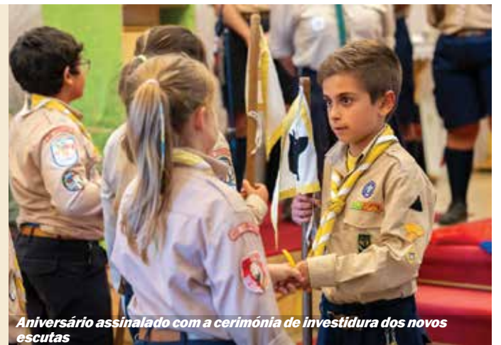
Aniversário assinalado com a cerimónia de investidura dos novos escutas

A Federação Portuguesa de Canoagem divulgou recentemente o ranking nacional da modalidade, no qual o CCA obteve o 3.º lugar coletivo, pelo terceiro ano consecutivo.