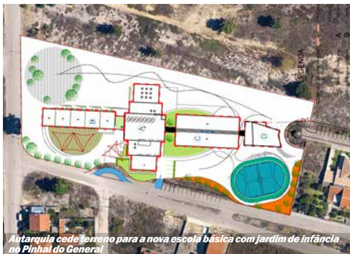
Autarquia cede terreno para a nova escola básica com jardim de infância no Pinhal do General