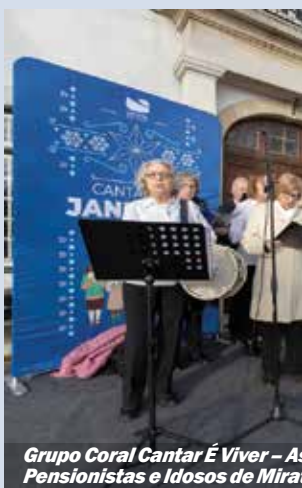
Grupo Coral Cantar É Viver – Associação Pensionistas e Idosos de Miralva