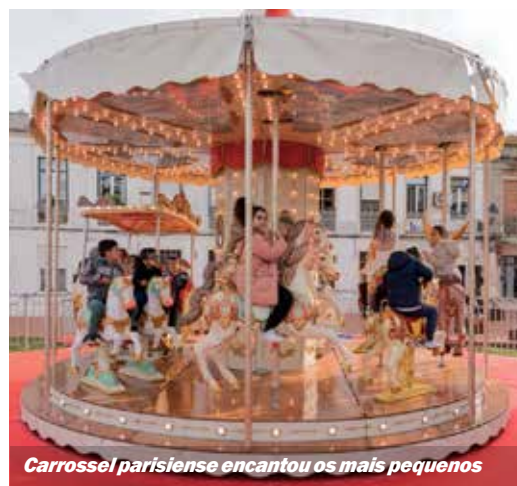
Carrossel parisiense encantou os mais pequenos