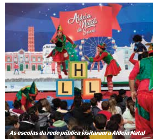
As escolas da rede pública visitaram a Aldeia Natal