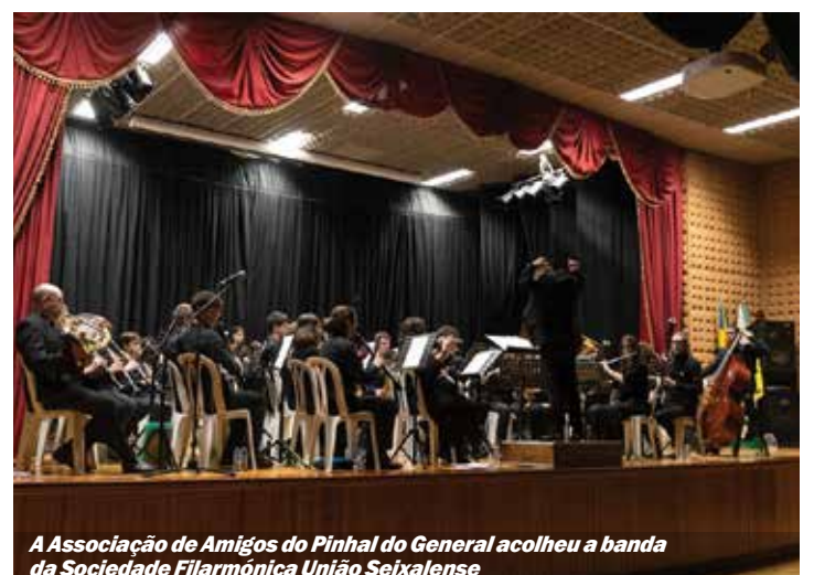
A Associação de Amigos do Pinhal do General acolheu a banda da Sociedade Filarmónica União Seixalense

No dia 6 de janeiro, também a Associação de Amigos do Pinhal do General acolheu a banda da Sociedade Filarmónica União Seixalense. O espetáculo decorreu no salão desta associação da freguesia de Fernão Ferro e juntou o passado da música filarmónica com as tendências do entretenimento moderno. Durante o ano de 2024, vai ainda percorrer diferentes localidades, dentro e fora do concelho. ■