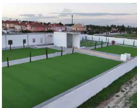
Abertura do novo Cemitério Municipal de Fernão Ferro