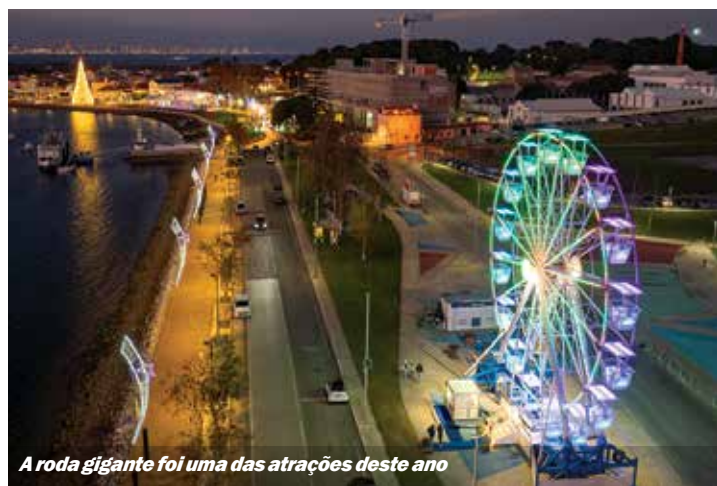
A roda gigante foi uma das atrações deste ano