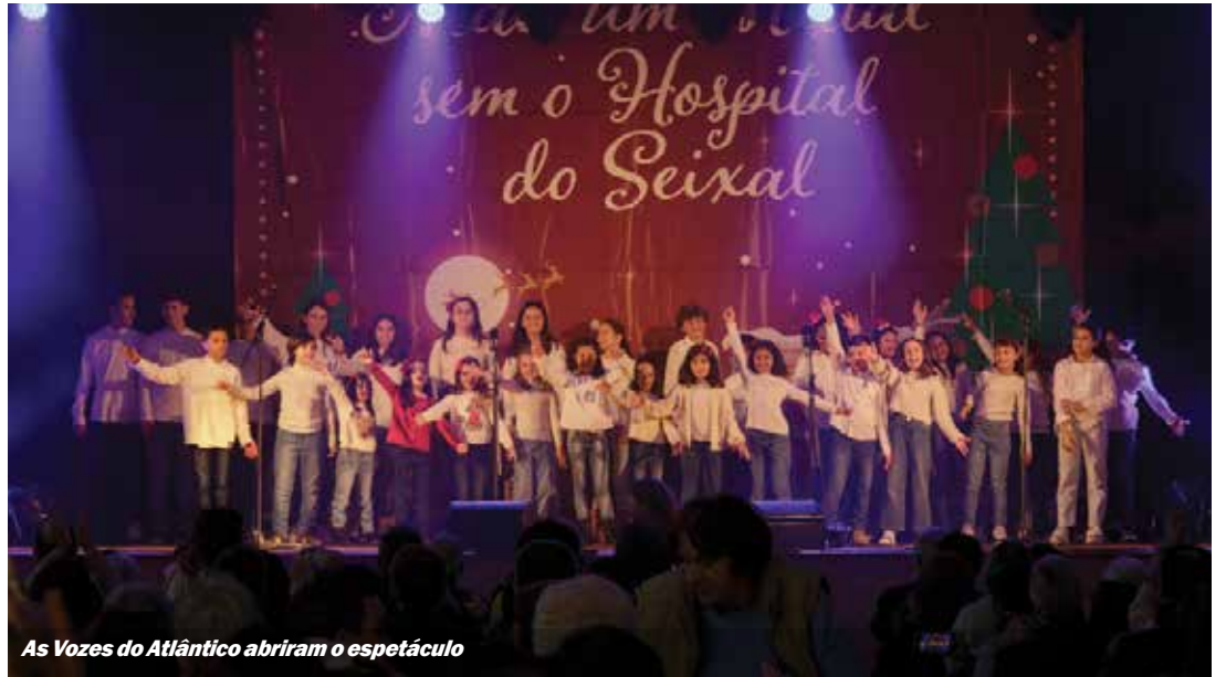
As Vozes do Atlântico abrem o espetáculo

O encontro teve em debate as abordagens das cirurgias geral e vascular e da medicina física e de reabilitação, as consultas de enfermagem, o pé diabético, as novas tecnologias ao serviço do combate à doença, a intervenção escolar, a nutrição ou a farmacologia adequada para diferentes casos clínicos.