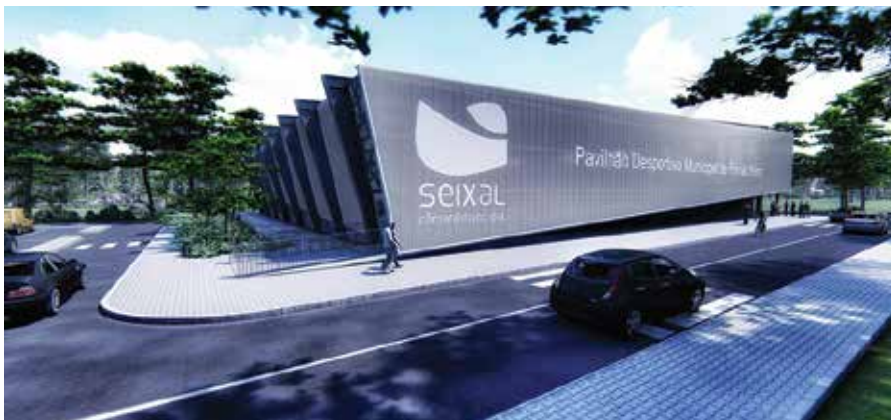
Abertura de concurso para a construção do Pavilhão Desportivo Municipal de Fernão Ferro