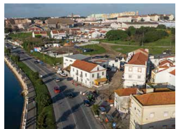
Continuar a empreitada de requalificação de infraestruturas e espaço público do núcleo urbano antigo de Arrentela