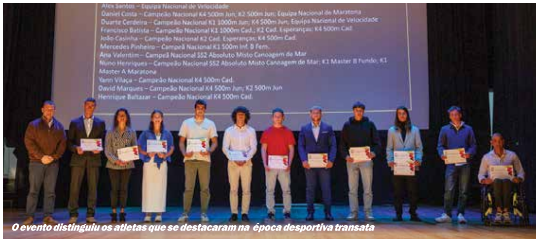
O evento distinguiu os atletas que se destacaram na época desportiva transata