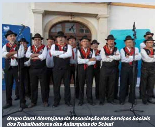
Grupo Coral Alentejano da Associação dos Serviços Sociais dos Trabalhadores das Autarquias do Seixal

o Rancho Folclórico da Casa do Povo de Corroios; o Grupo de Concertinas dos Redondos, da Associação de Moradores dos Redondos; o Grupo de Música Tradicional Cantares D'Arte, da Bastidores D'Arte – Associação Cultural; o Grupo Coral e Instrumental Os Flamingos, do Clube Recreativo e Desportivo das Cavaquinhas; o Grupo Coral Recordar É Viver, da Associação Unitária de Reformados, Pensionistas e Idosos da Torre da Marinha; o Grupo Coral Os Sempre Jovens, da Associação Unitária de Reformados,