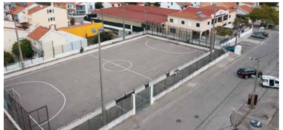
Construção do pavilhão da Associação de Moradores dos Redondos