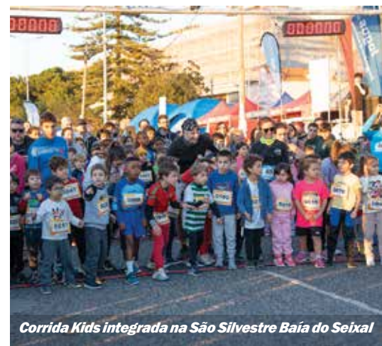
Corrida Kids integrada na São Silvestre Baía do Seixal