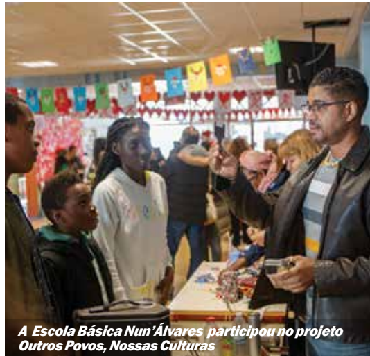
A Escola Básica Nun'Álvares participou no projeto Outros Povos, Nossas Culturas