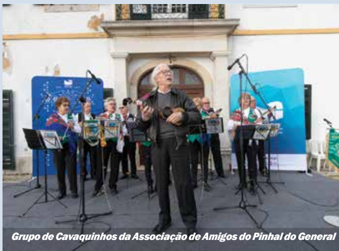
Grupo de Cavaquinhos da Associação de Amigos do Pinhal do General

Pensionistas e Idosos de Corroios; o Grupo Coral Além Terra, da Associação de Reformados, Pensionistas e Idosos de Arrentela; o Grupo Coral Os Alegres de Paio Pires, da Associação Unitária de Reformados Pensionistas e Idosos de Paio Pires; e o Grupo Coral Cantar D'Amigos, da Associação Unitária de Reformados, Pensionistas e Idosos do Casal do Marco. ■