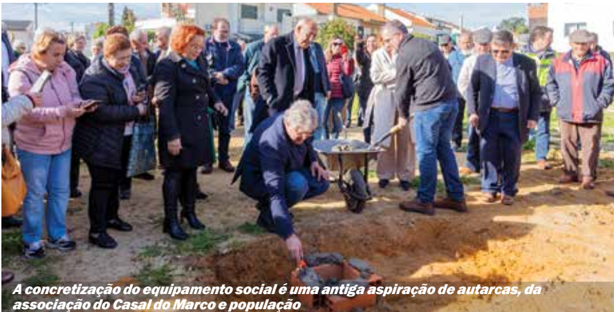
A concretização do equipamento social é uma antiga aspiração de autarcas, da associação do Casal do Marco e população

volvimento Social e Cidadania e composto pelo Instituto de Segurança Social, a Comissão de Proteção de Crianças e Jovens, o Instituto de Emprego e Formação Profissional, o Centro Paroquial de Bem-Estar Social de Arrentela, a Criar-T, o Agrupamento de Centros de Saúde Almada-Seixal e os agrupamentos de escolas Nun' Álvares e Paulo da Gama.