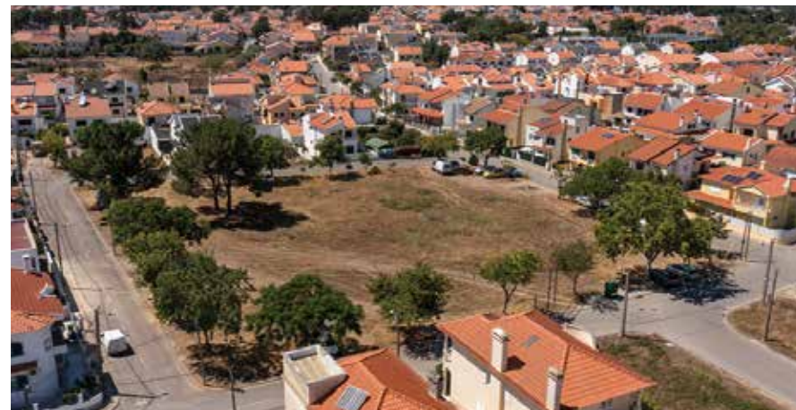
A construção do Centro de Saúde dos Foros de Amora vai avançar. A candidatura a financiamento do Plano de Recuperação e Resiliência já foi aprovada, com a respetiva assinatura de contrato de financiamento