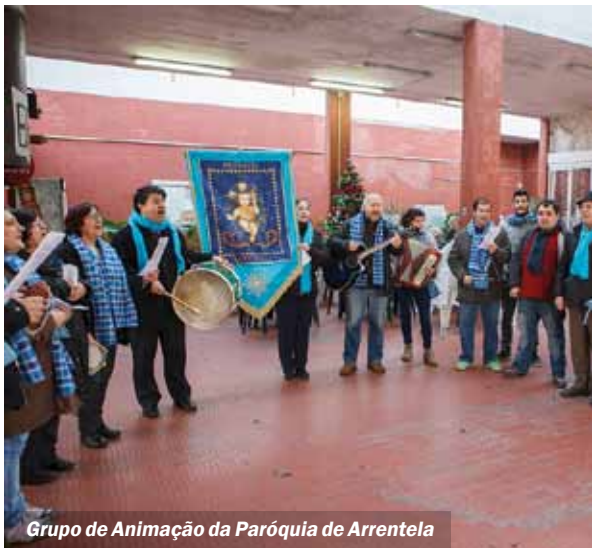
Grupo de Animação da Paróquia de Arrentela