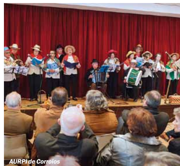
AURPI de Corroios