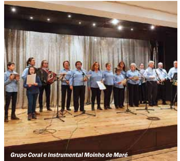
Grupo Coral e Instrumental Moinho de Maré