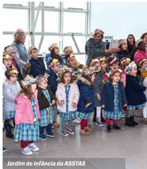
Jardim de Infância da ASSTAS