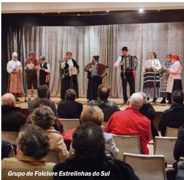
Grupo de Folclore Estrelinhas do Sul