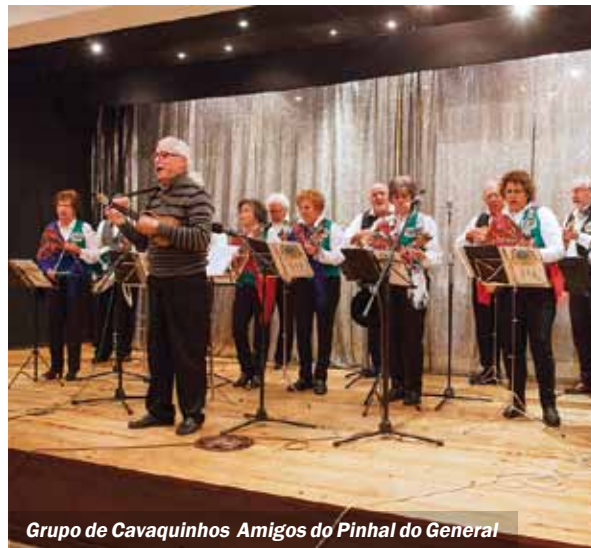
Grupo de Cavaquinhos Amigos do Pinhal do General