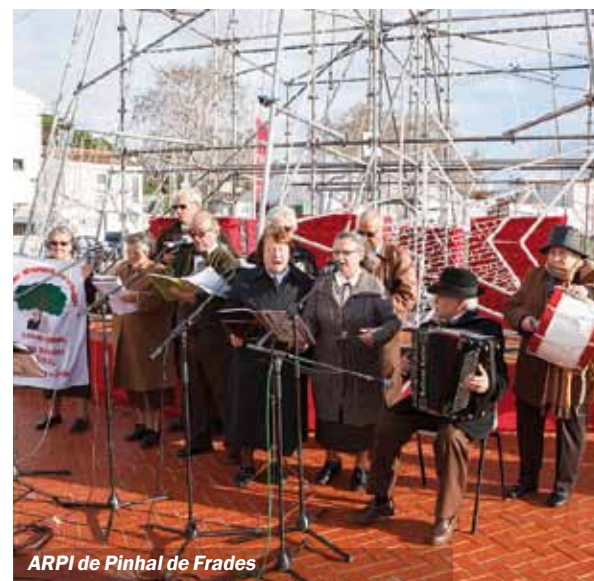
ARPI de Pinhal de Frades