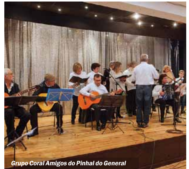
Grupo Coral Amigos do Pinhal do General