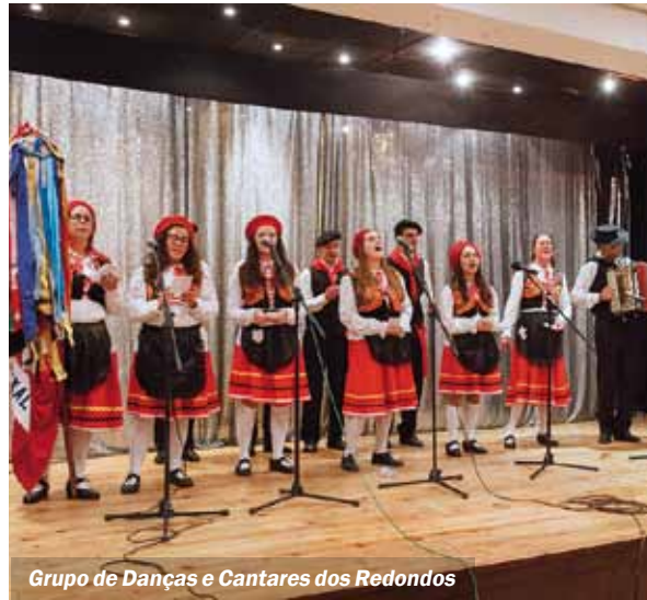
Grupo de Danças e Cantares dos Redondos