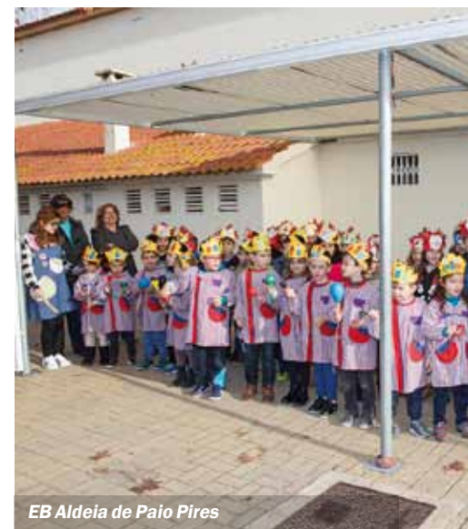
EB Aldeia de Paio Pires