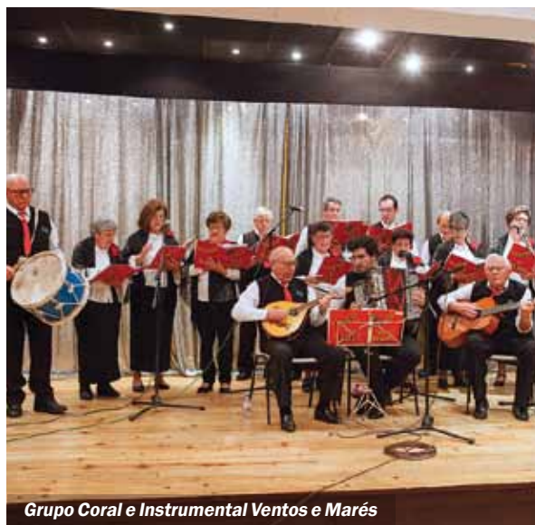
Grupo Coral e Instrumental Ventos e Marés