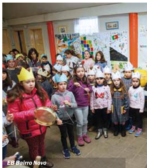
EB Bairro Novo

A Aldeia Natal do Seixal foi verdadeiramente um espaço onde se viveu em pleno a quadra natalícia com atividades para toda a família. ■