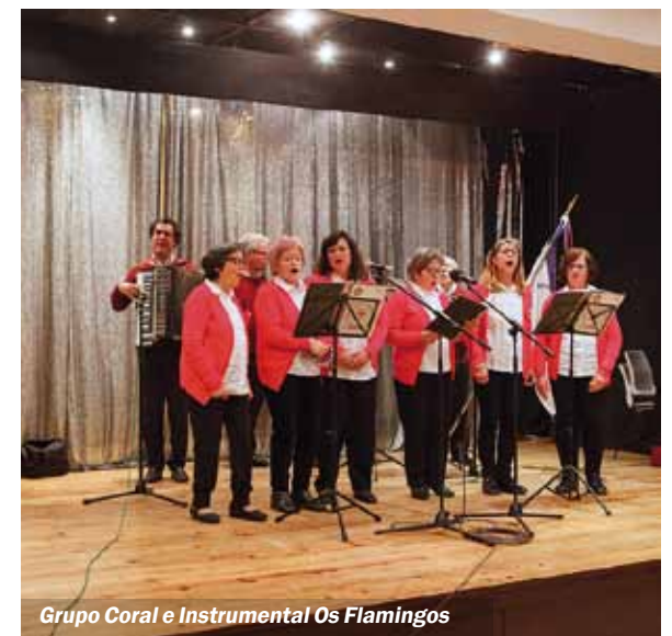
Grupo Coral e Instrumental Os Flamingos