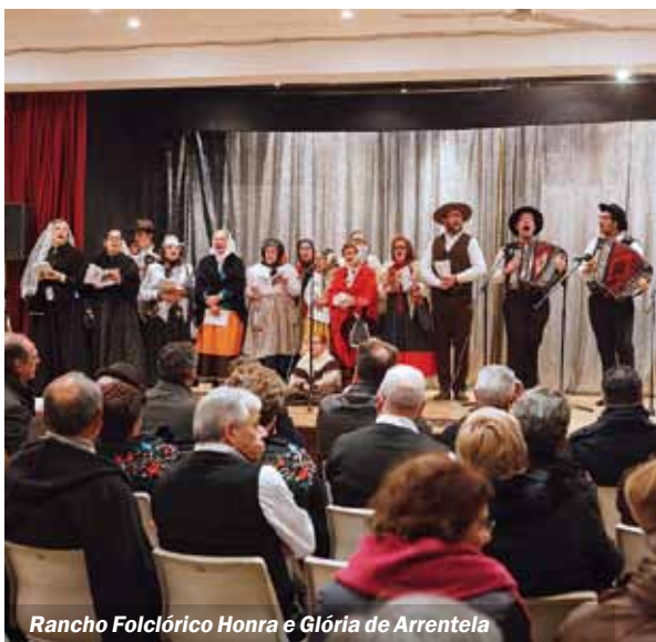
Rancho Folclórico Honra e Glória de Arrentela