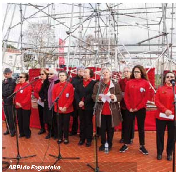
ARPI do Fogueteiro