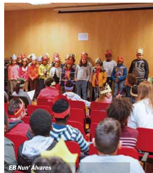
EB Nun' Álvares