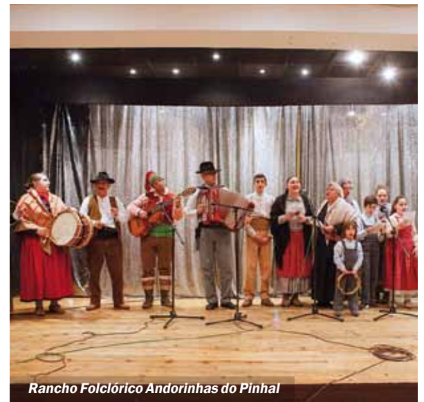
Rancho Folclórico Andorinhas do Pinhal