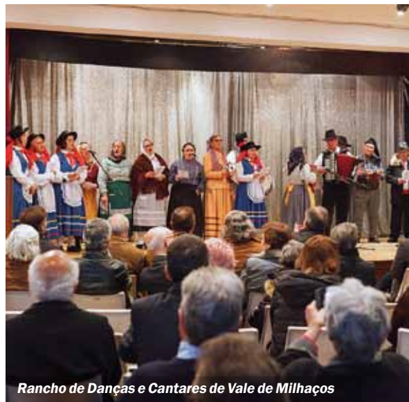
Rancho de Danças e Cantares de Vale de Milhaços