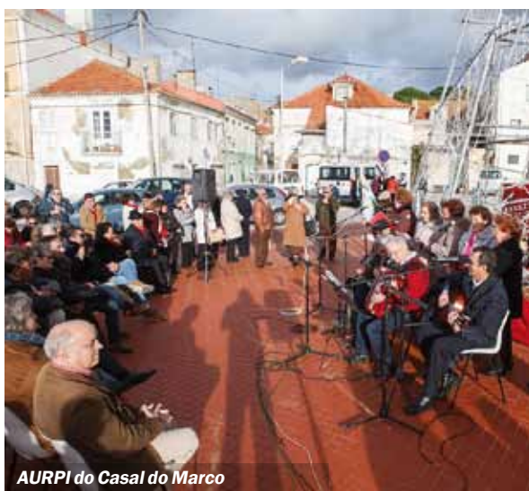
AURPI do Casal do Marco