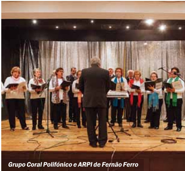
Grupo Coral Polifónico e ARPI de Fernão Ferro