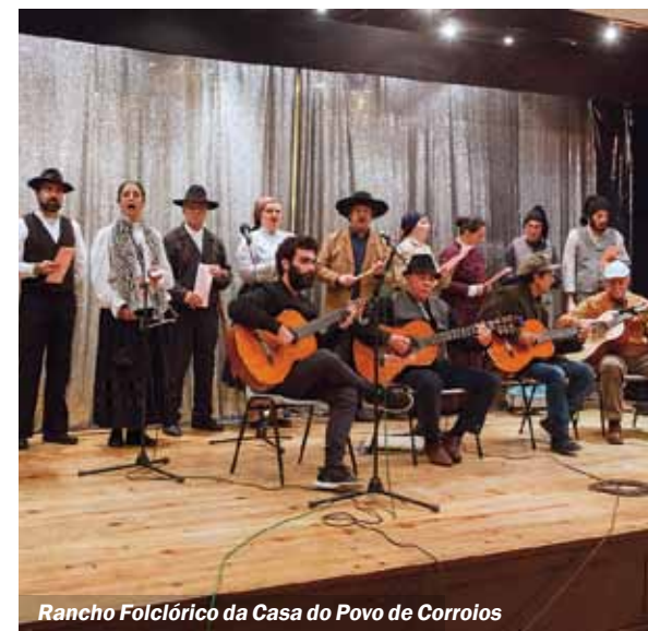
Rancho Folclórico da Casa do Povo de Corroios