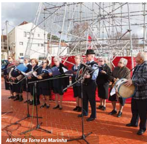
AURPI da Torre da Marinha