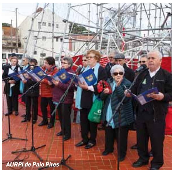
AURPI de Paio Pires