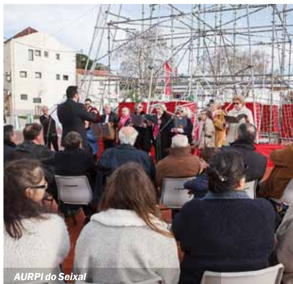
AURPI do Seixal