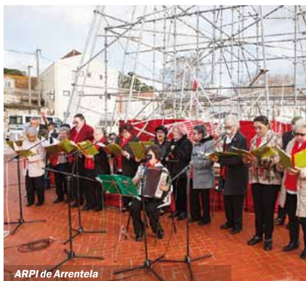
ARPI de Arrentela

O eleitos da câmara municipal estiveram presentes na atuação dos grupos. ■