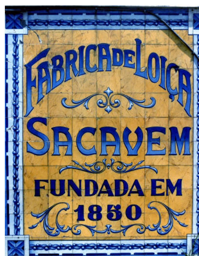
Museu de Cerâmica de Sacavém