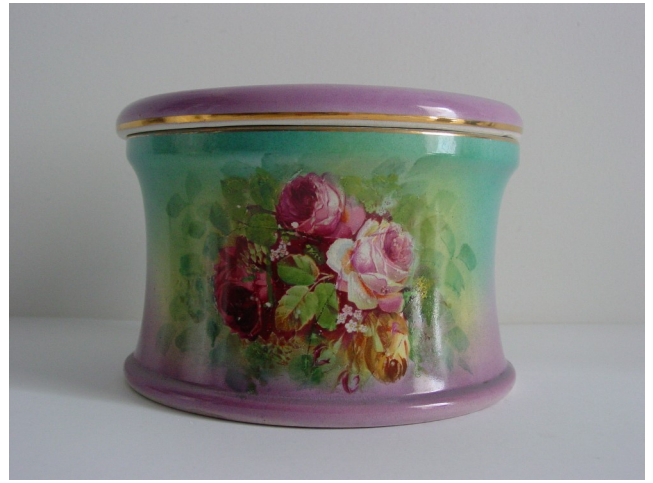
Escarrador em faiança da Fábrica da Mundet & C a Lda., Seixal. Escarrador em faiança da Fábrica de Loiça de Sacavém. MCS 1023.

Este formato em faiança terá sido, sobretudo, utilizado pelos empregados de escritório, pelos desenhadores, técnicos e pessoal superior da Mundet, pelos agentes comerciais e pelos clientes da empresa em visita à fábrica (o escarrador foi recolhido pelos técnicos do Ecomuseu Municipal do Seixal numa área de arrumos dos antigos escritórios de produção da fábrica). Na maioria das oficinas, os operários dispunham de vulgares escarradores em chapa esmaltada para uso coletivo, deixados à sua disposição no chão.