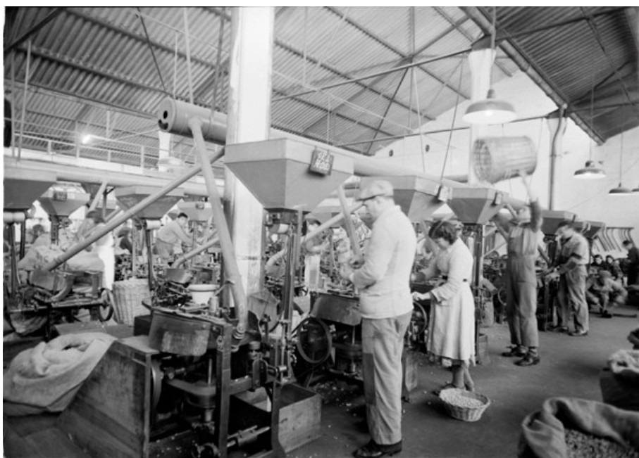
Fábrica da Mundet & C a Lda. Amora, 1954 © EMS-CDI - Fundo Documental Mundet.

Nas oficinas da fábrica, largas centenas de operários, por vezes mal alimentados, eram submetidos durante muitas horas a um trabalho de movimentos repetitivos e ritmados pela cadência das máquinas, num espaço confinado e sem ventilação apropriada.