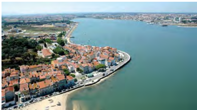
SEIXAL – VISTA AÉREA SEIXAL – AERIAL VIEW