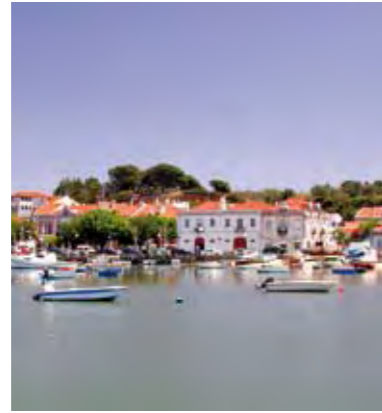
EMBARCAÇÕES DE RECREIO NA BAÍA DO SEIXAL RECREATIONAL BOATS IN SEIXAL BAY

27 JULHO [domingo], das 9.30 às 16.30 horas / Passeio no Tejo a bordo do bote-de-fragata Baía do Seixal / Almoço num restaurante do concelho / Passeio pedestre no núcleo urbano antigo do Seixal com visita à Igreja Matriz e ao Núcleo da Mundet do Ecomuseu Municipal do Seixal