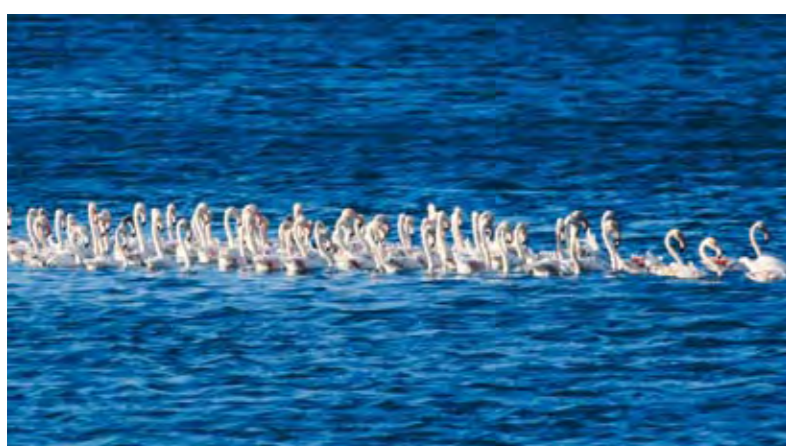
BAÍA DO SEIXAL – COLÓNIA DE FLAMINGOS SEIXAL BAY – FLAMINGO COLONY