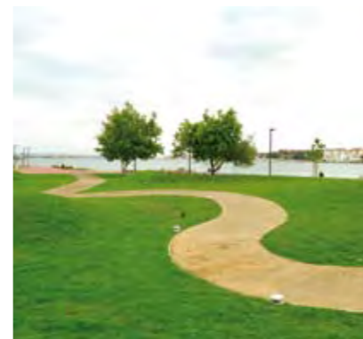
CICLOVIA ENTRE SEIXAL E ARRENTELA CYCLING PATH BETWEEN SEIXAL AND ARRENTELA

Ticket Fees: 2, 50 € (price includes personal accidents insurance).