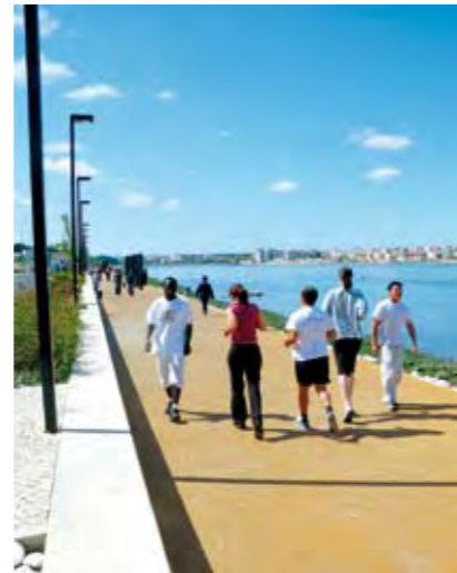
SEIXAL: NÚCLEO URBANO ANTIGO E BAÍA – VISTA AÉREA SEIXAL: HISTORIC CENTRE AND BAY – AERIAL VIEW

PREÇO POR PESSOA E CIRCUITO: 14,79 € (maiores de 12 anos) e 6 € (até 12 anos). Deslocações em autocarro municipal (sempre que necessário) e acompanhamento de um técnico de turismo. O preço inclui seguro de acidentes pessoais