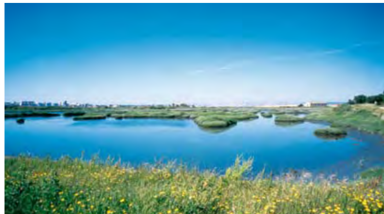
ZONA DE SAPAL (CORROIOS) – ÁREA PROTEGIDA INCLUIDA NA RESERVA ECOLÓGICA NACIONAL MARSHLAND ZONE (CORROIOS) – PROTECTED AREA INCLUDED IN THE NATIONAL ECOLOGICAL RESERVE