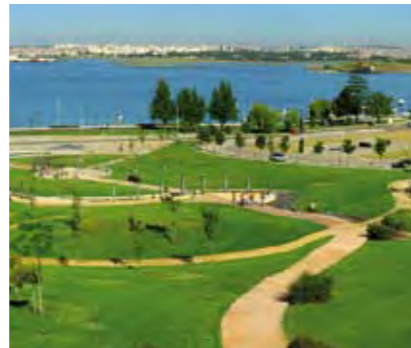
PARQUE DA QUINTA DOS FRANCÊSES QUINTA DOS FRANCÊSES PARK

10 MAIO [sábado], das 15 às 17,30 horas / Passeio pedestre com início junto ao Posto Municipal de Turismo - R. Paiva Coelho - Praça Luís de Camões - Largo dos Restauradores - Av. Nuno Álvares Pereira (marginal) - Praça 1.º de Maio - Núcleo da Mundet do Ecomuseu Municipal do Seixal (visita) - Igreja Matriz Seixal (visita) - Posto Municipal de Turismo (fim)