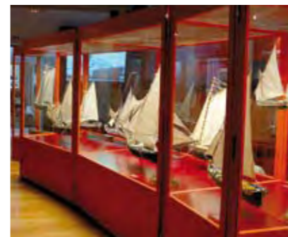
NÚCLEO NAVAL DO ECOMUSEU MUNICIPAL DO SEIXAL – ASPECTO GERAL DA EXPOSIÇÃO BARCOS, MEMÓRIAS DO TEJO SEIXAL MUNICIPAL ECOMUSEUM'S NAVAL UNIT – BOATS: MEMORY OF THE TAGUS GENERAL VIEW OF THE EXPOSITION