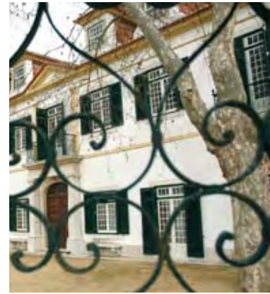
QUINTA DA FIDALGA – FACHADA DO PALACETE FIDALGA ESTATE – MANOR HOUSE FACADE

31 MAIO [sábado], das 10.30 às 17.30 horas / Passeio no Tejo a bordo do bote-de-fragata Baía do Seixal / Almoço num restaurante do concelho / Visita à Quinta da Fidalga e à Quinta do Álamo / Circuito em autocarro com visualização das Quintas da Princesa e de Cheiraventos