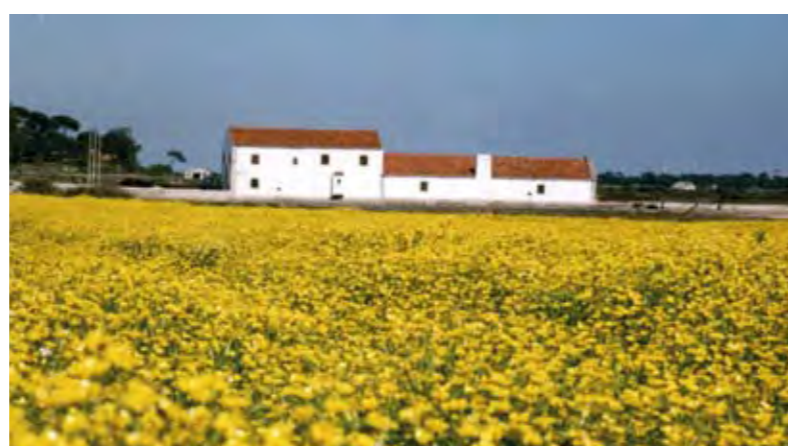
MOINHO DE MARÉ DE CORROIOS – PERSPECTIVA DA ZONA ENVOLVENTE CORROIOS TIDE MILL – PERSPECTIVE OF THE SURROUNDING AREA