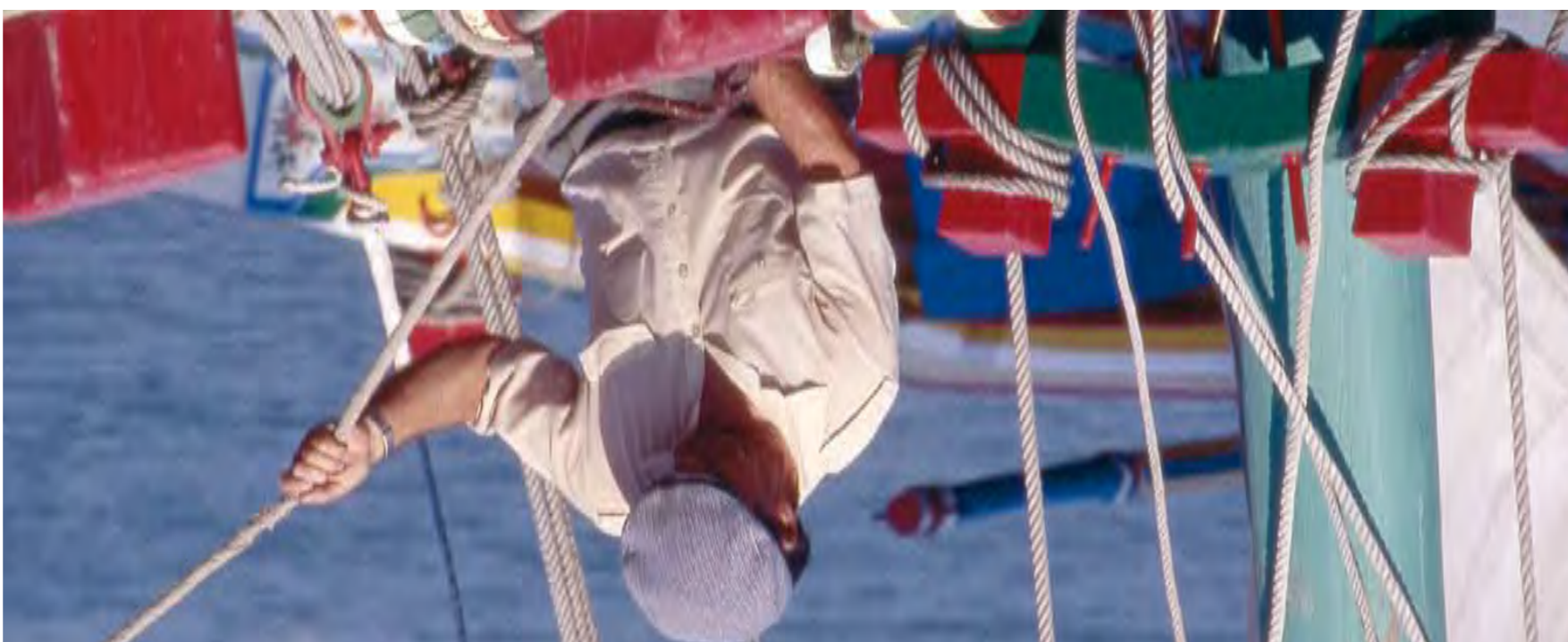
BOTE-DE-FRAGATA BAÍA DO SEIXAL – NAVEGAÇÃO TRADICIONAL À VEIA TRADITIONAL CRAFT SAILING