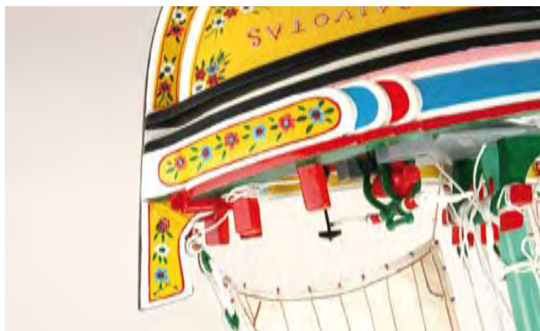
GAVIOLAS – PORMENOR DA EMBARCAÇÃO SEAGULS – TRADITIONAL CRAFT DETAIL

PROGRAMAS TURÍSTICO-CULTURAIS NO CONCELHO DO SEIXAL SEIXAL TOUR PROGRAM