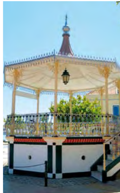
CORETO DA AMORA (CONSTRUÍDO EM 1907) AMORA BANDSTAND (BUILT IN 1907)

13 SETEMBRO [domingo], das 14.30 às 17.30 horas / Passeio pedestre entre Amora e Arrentela, com início junto ao Coreto (Praça 5 de Outubro) - Av. Silva Gomes - Ponte da Fraternidade - ciclovia - Igreja Matriz de Arrentela e miradouro (visita) - núcleo urbano antigo de Arrentela - Núcleo Naval do Ecomuseu Municipal do Seixal (visita) - Regresso a Amora pela ciclovia (fim)