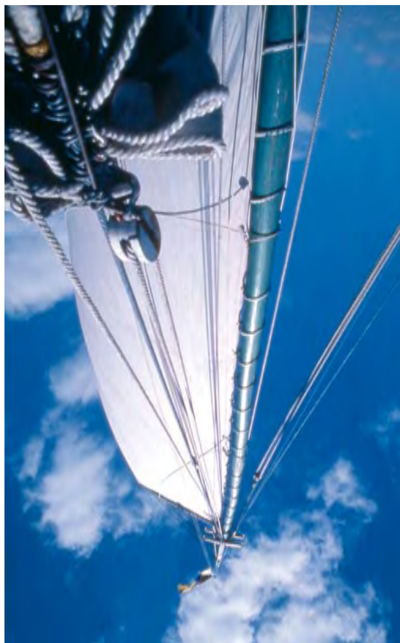
EMBARCAÇÃO TRADICIONAL DO TIPO – PORMENOR DAS VELAS TRADITIONAL CRAFT – SAIL SHOWN IN DETAIL