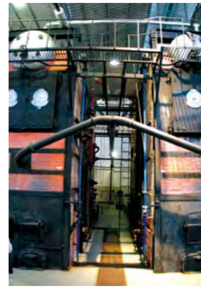
CALDEIRAS BARCOCK & WILCOX (NÚCLEO MUNDET DO ECOMUSEU MUNICIPAL DO SEIXAL) BARCOCK & WILCOX INDUSTRIAL BOILERS (SEIXAL MUNICIPAL ECOMUSEUM'S MUNDET UNIT)

DECEMBER, 13th [saturday], 2 p.m. / 5 p.m. / Visit to the Seixal Municipal Ecomuseum's Naval Unit / Visit to Corroios Tide Mill Unit (exterior) / Visit to Seixal Municipal Ecomuseum's Mundet Unit (former cork factory)