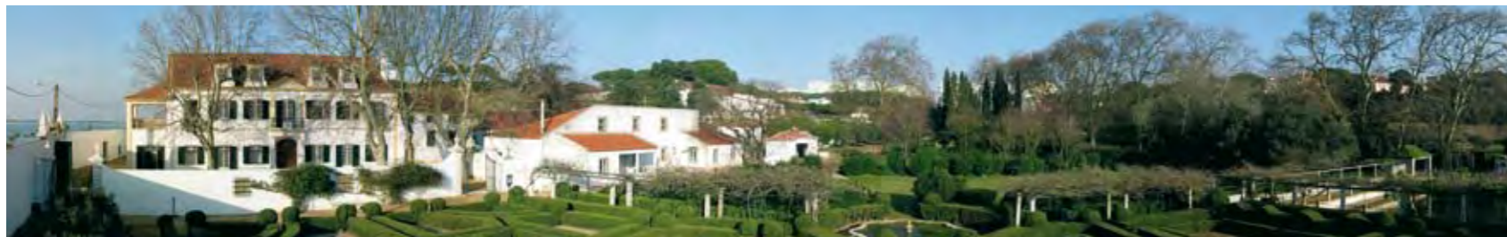
QUINTA DA FIDALGA – PANORÂMICA GERAL DA FACHADA E DO JARDIM FIDALGA ESTATE – MANOR HOUSE AND GARDEN GENERAL VIEW