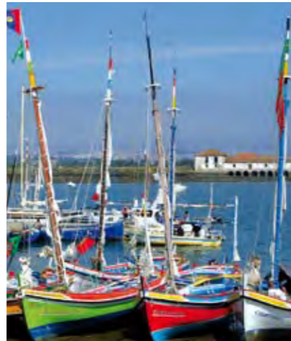
EMBARCAÇÕES TRADICIONAIS DO TEJO ANCORADAS NO SEIXAL TAGUS TRADITIONAL CRAFT ANCHORED IN SEIXAL

10 AGOSTO [domingo], das 9,30 às 17 horas / Passeio no Tejo a bordo do bote-de-fragata Baía do Seixal / Almoço num restaurante do concelho / Visita ao Núcleo Naval do Ecomuseu Municipal do Seixal / Visita à Igreja de N. Sra. da Consolação (Arrentela) e miradouro