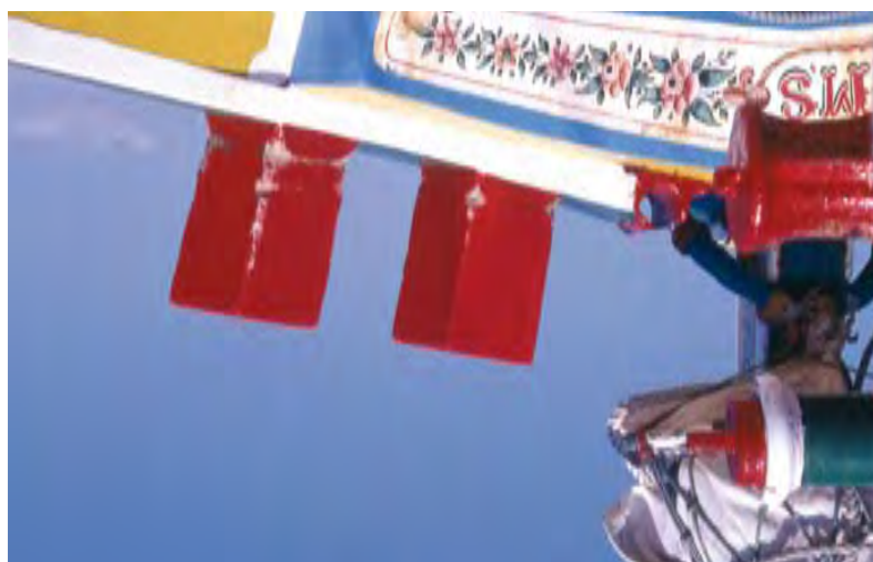
BOTE-DE-FRAGATA BAÍA DO SEIXAL – PORMENOR DA DECORAÇÃO TRADITIONAL CRAFT – AN ORNAMENTAL DETAIL