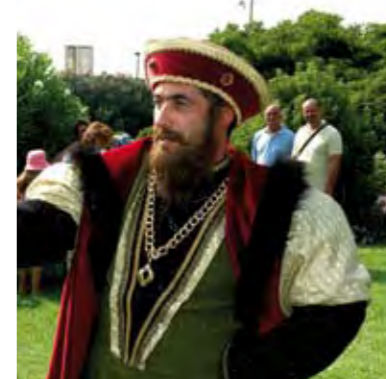
O PERSONAGEM PAULO DA GAMA NOS JARDINS DA QUINTA DA FIDALGA THE "RETURN" TO SEIXAL OF THE NAVIGATOR PAULO DA GAMA

Entrada gratuita. Público infanto-juvenil e famílias Free admission. Aimed to children, teenagers and families